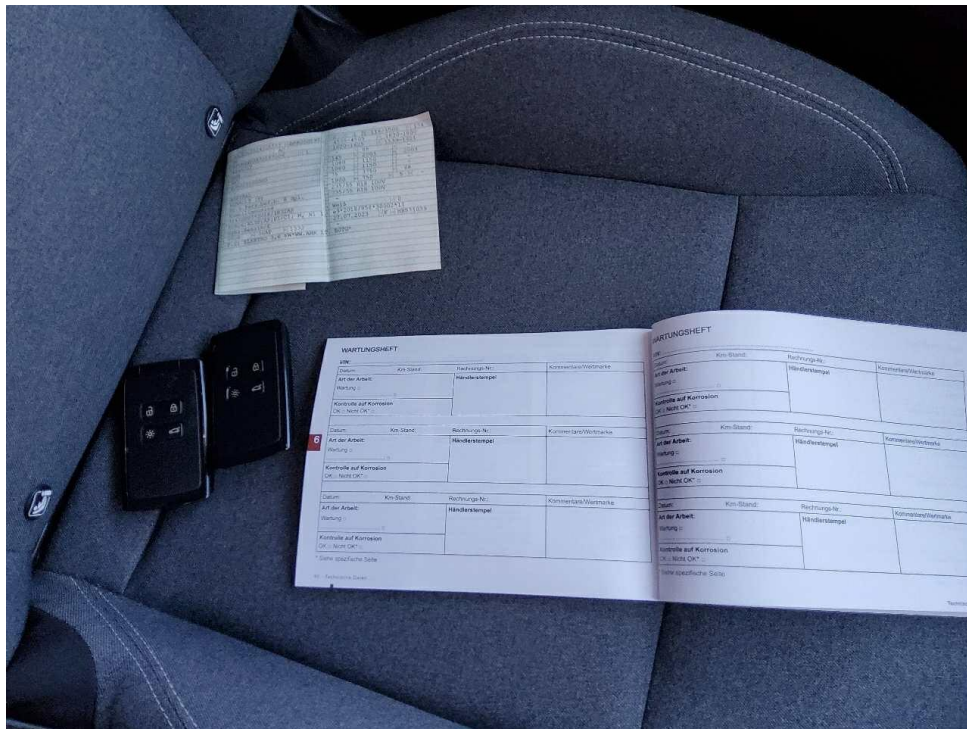
Bild 8 : Alle Fz-Schlüssel, ZLB 1, Letzter Eintrag im Serviceheft