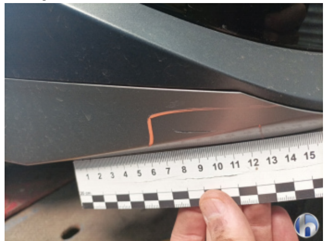
1. Frontspoiler Beschädigt - Smart Repair