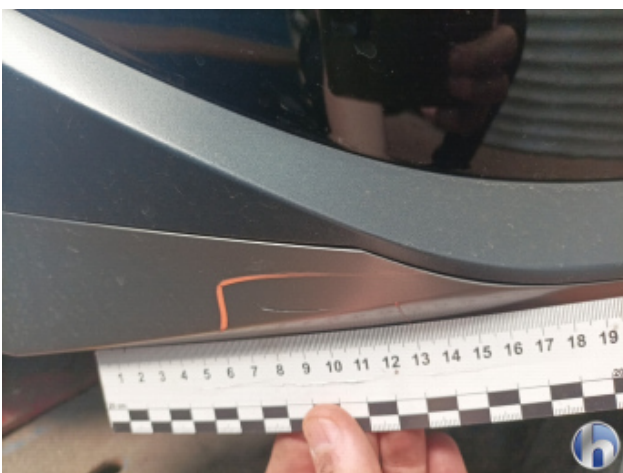
1. Frontspoiler Beschädigt - Smart Repair