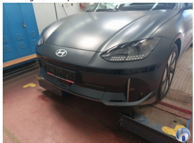
1. Frontspoiler Beschädigt - Smart Repair