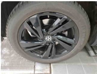
Räder - Rad montiert hinten rechts