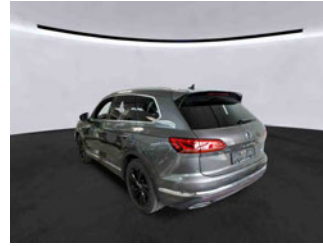
Fahrzeugansicht - diagonal hinten links