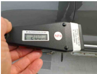
Lackstärke Tür hinten rechts