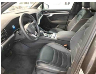
Innenraum - vorne