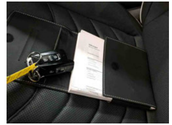
Equipment - Boardmappe/ Securitybag