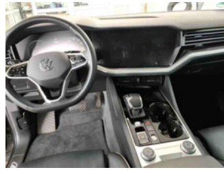
Innenraum - Mittelkonsole