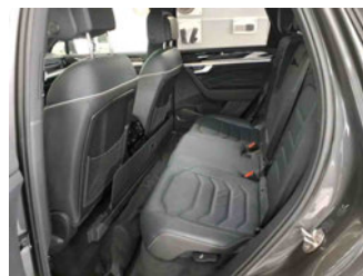
Innenraum - hinten