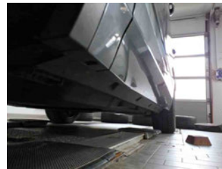
Seitenansicht - Schweller links