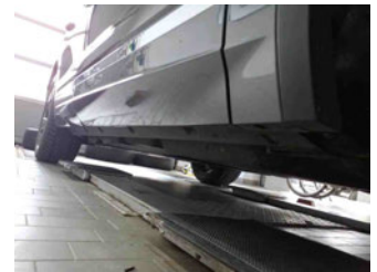
Seitenansicht - Schweller rechts