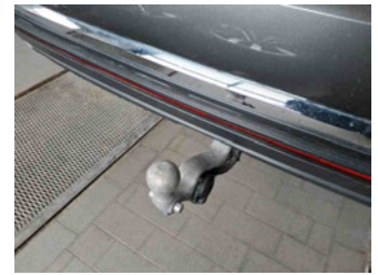
Equipment - Anhängerkupplung