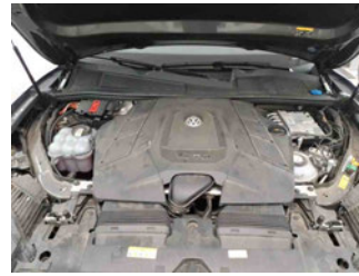
Fahrzeug - Motorraum offen