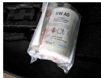
Räder - Haltbarkeitsdatum Tirefit