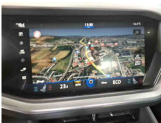
Innenraum - Navigationsgerät/Radio