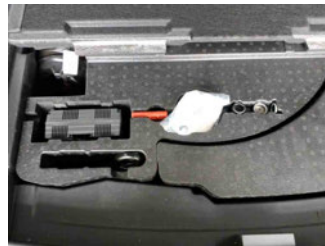
Equipment - Bordwerkzeug