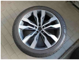
Räder - Rad beiliegend #4