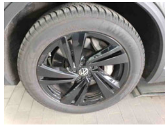
Räder - Rad montiert vorne links