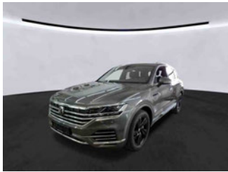
Fahrzeugansicht - diagonal vorne links

Auftrags-Nr: 1002378491 Besichtigt am: 20.04.2026 14:09 Berichts-Nr: 10457472 FIN: WVGZZZCR1PD020185