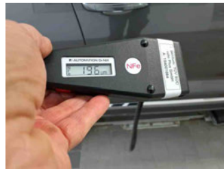
Lackstärke Tür vorne rechts