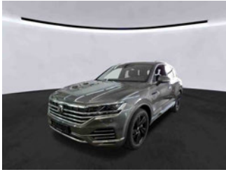
Fahrzeugansicht - diagonal vorne links