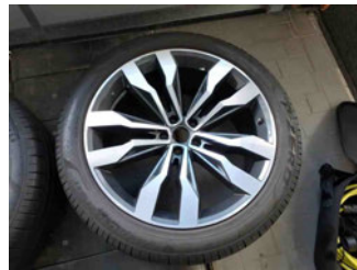
Räder - Rad beiliegend #1