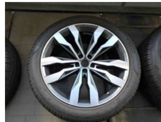
Räder - Rad beiliegend #2