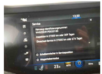
Fahrzeug - Serviceunterlagen / Wartungsnachweis