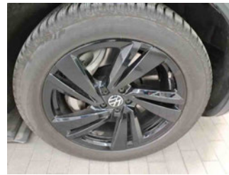
Räder - Rad montiert vorne rechts