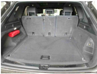
Innenraum - Kofferraum