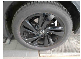
Räder - Rad montiert hinten links