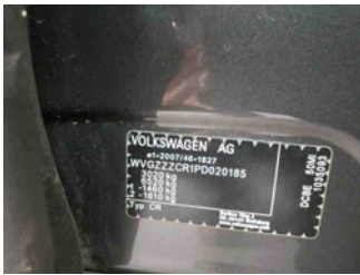
Fahrzeug - Typenschild/Fahrgestellnummer