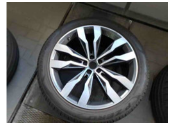
Räder - Rad beiliegend #3