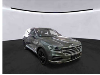
Fahrzeugansicht - diagonal vorne rechts