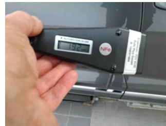
Lackstärke Seitenwand hinten rechts