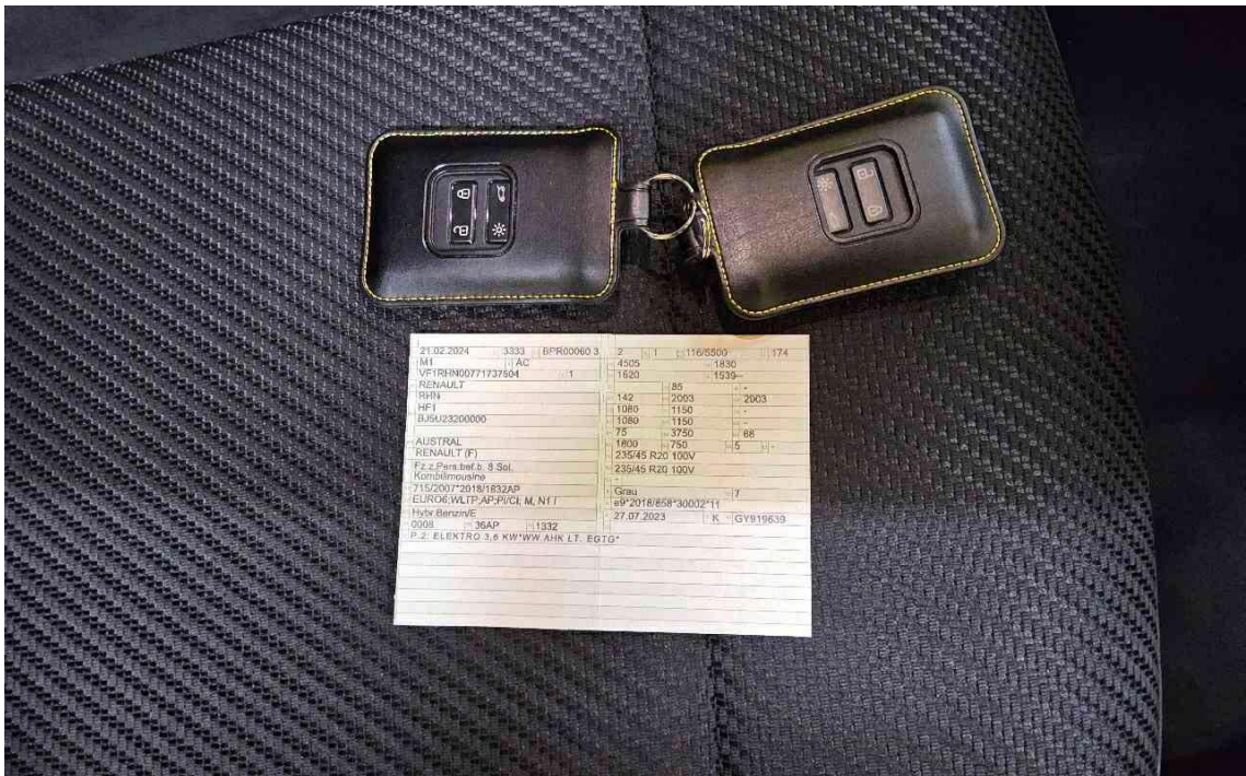
Bild 8 : Alle Fz-Schlüssel, ZLB 1, Letzter Eintrag im Serviceheft