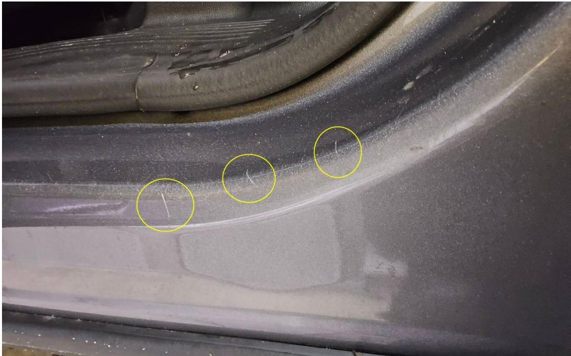
Bild 11 : Tür hinten links Einstieg Lackierung, verschrammt, smart repair