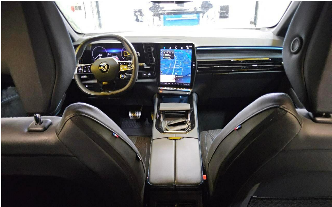
Bild 7 : Mittelkonsole des Rücksitzes (Radio/Navigation eingeschaltet)