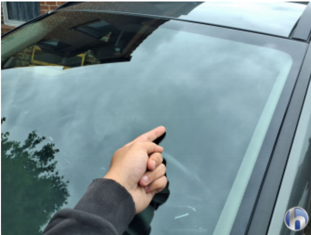
1. Windschutzscheibe Gebrauchsspuren - Ohne Reparatur