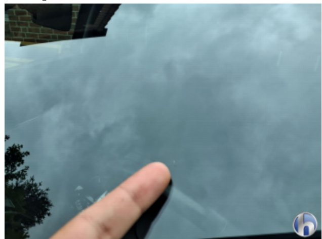
1. Windschutzscheibe Gebrauchsspuren - Ohne Reparatur