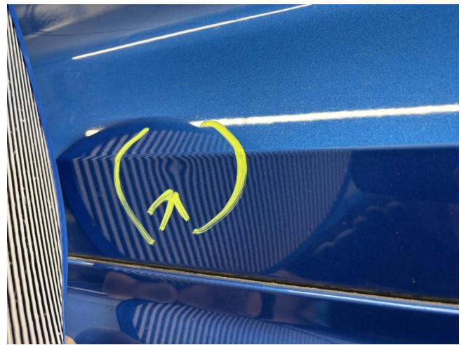
Tür vorne links - Delle - entfernen