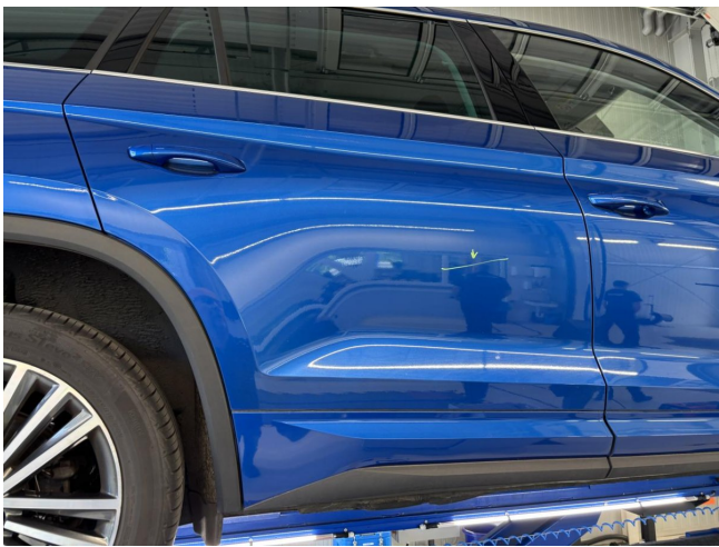
Tür hinten rechts - Kratzer - polieren