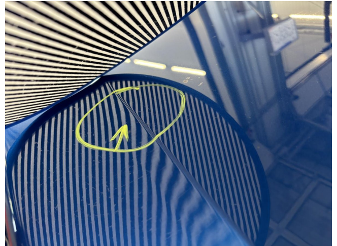
Motorhaube - Delle - entfernen