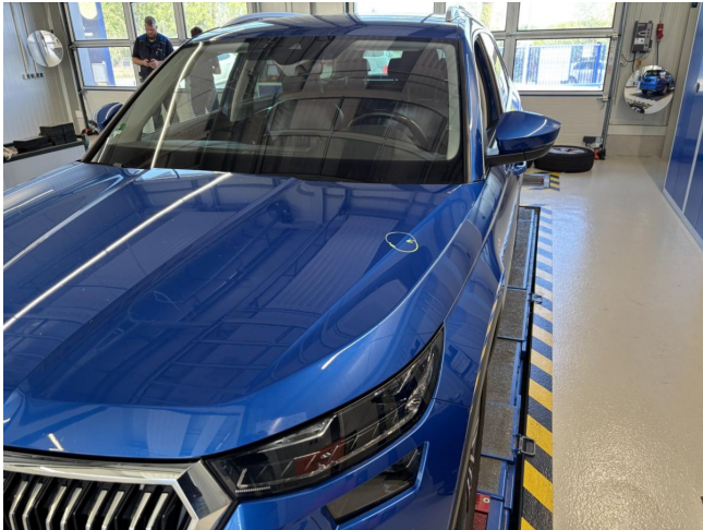
Motorhaube - Delle - entfernen