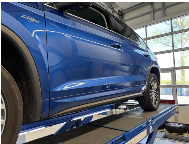
Tür vorne links - Delle - entfernen