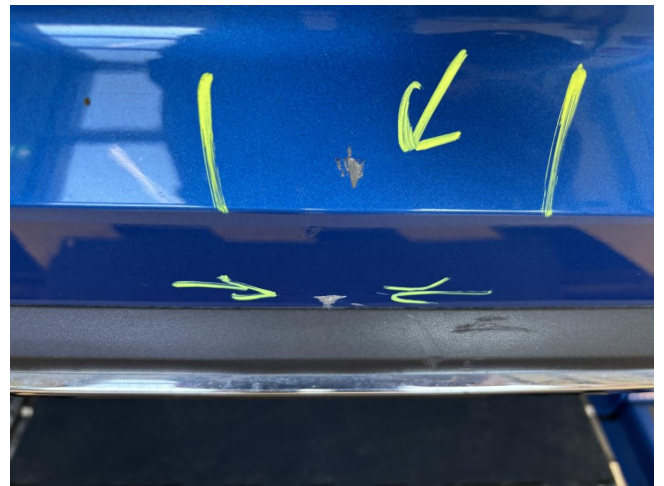
Stoßfänger hinten - zerkratzt - smart Repair