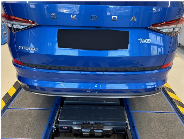
Stoßfänger hinten - zerkratzt - smart Repair