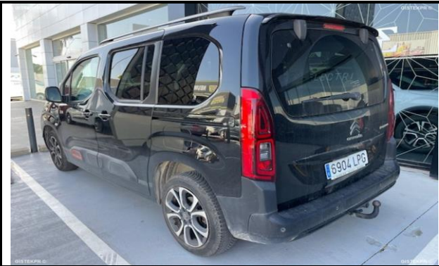
FTLTI_FOTOS TRASERA LATERAL IZQUIERDA