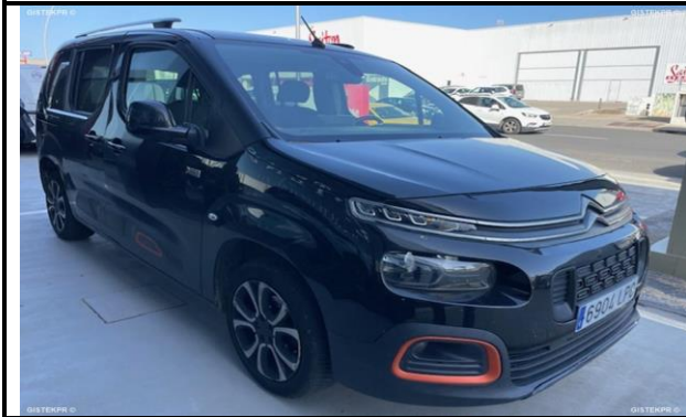
FFLTD_FOTOS FRONTO LATERAL DERECHA

INFORME-STELL-RE-1198- 2025_(9513694992- 6904LPG).DOC