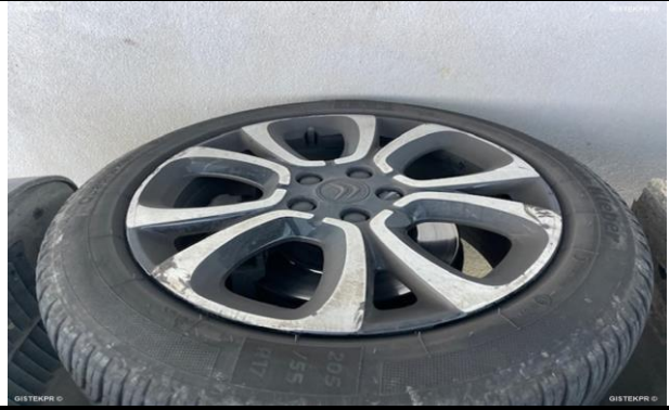
FLLAN, FOTOS LLANTAS