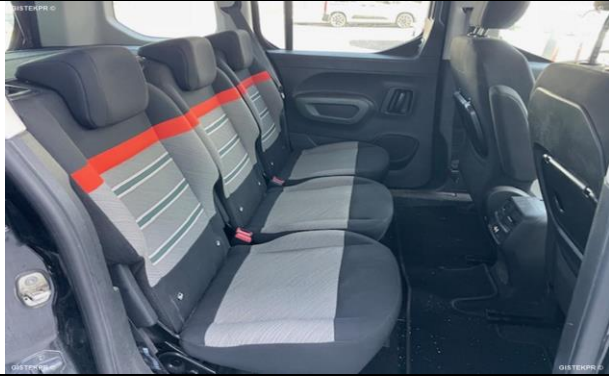
FASTRAS_FOTOS ASIENTOS TRASEROS