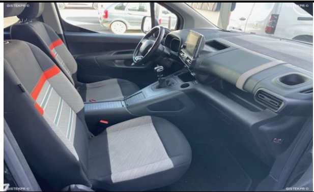
FASDEL_FOTOS ASIENTOS DELANTEROS