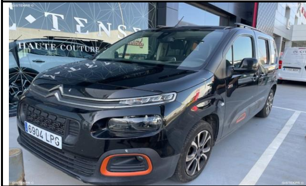
FFLTI_FOTOS FRONTO LATERAL IZQUIERDA

INFORME-STELL-RE-1198- 2025_(9513694992- 6904LPG).DOC