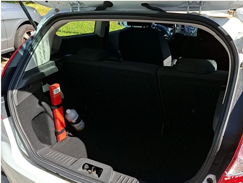
Bild 15 Laderaum, Abdeckung, fehlt, ersetzen