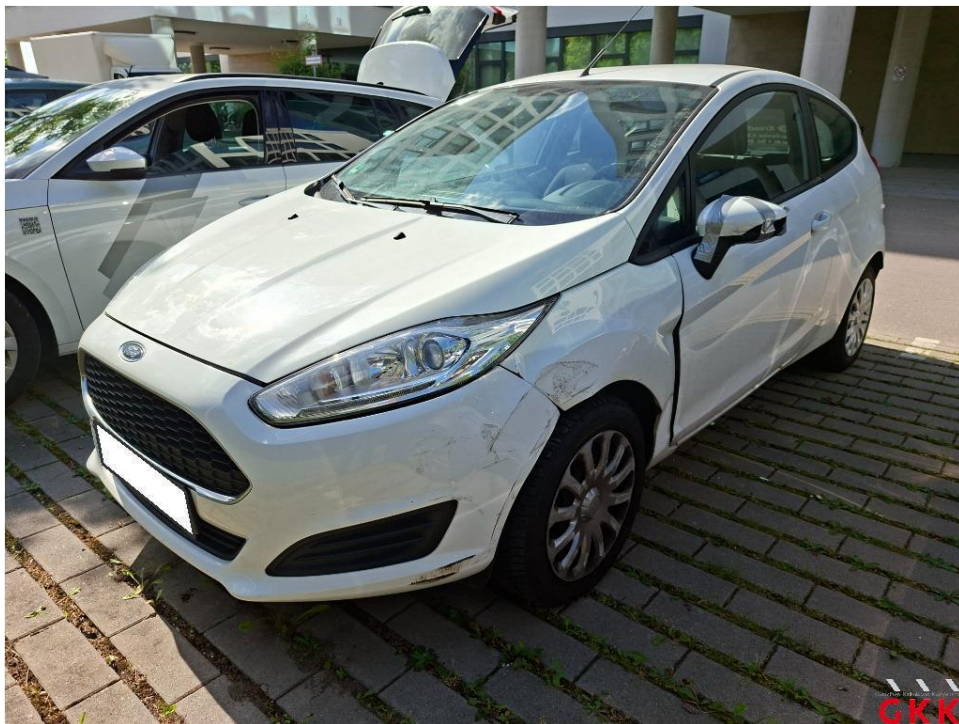
Bild 16 Fahrzeug, Seite links, Unfallschaden, Unfallschaden beheben