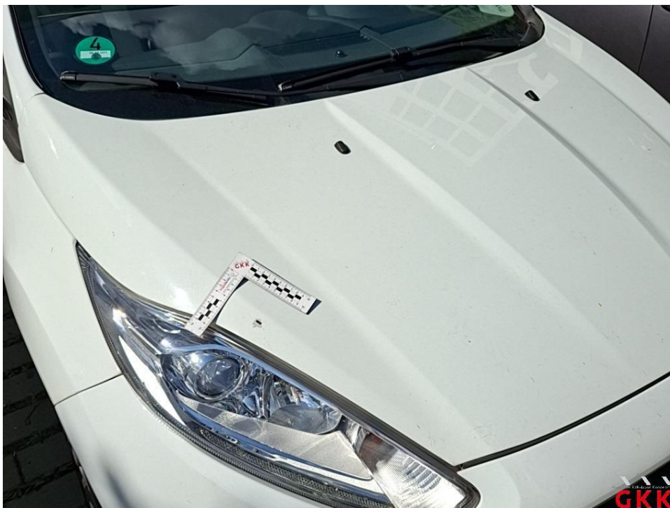
Bild 26 Motorhaube, beschädigt, instand setzen - lackieren