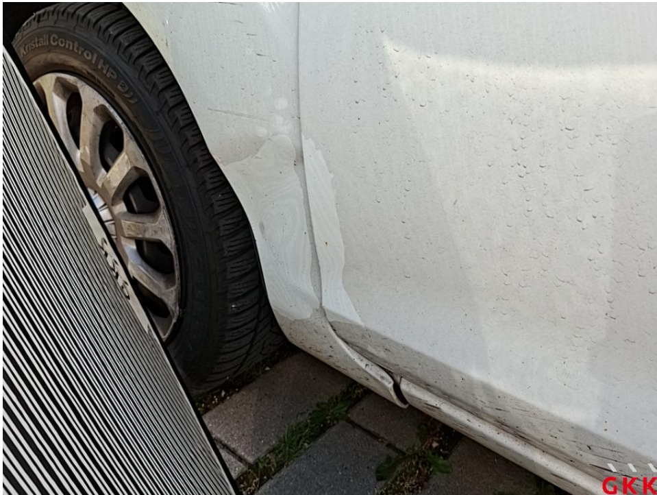
Bild 19 Fahrzeug, Seite links, Unfallschaden, Unfallschaden beheben