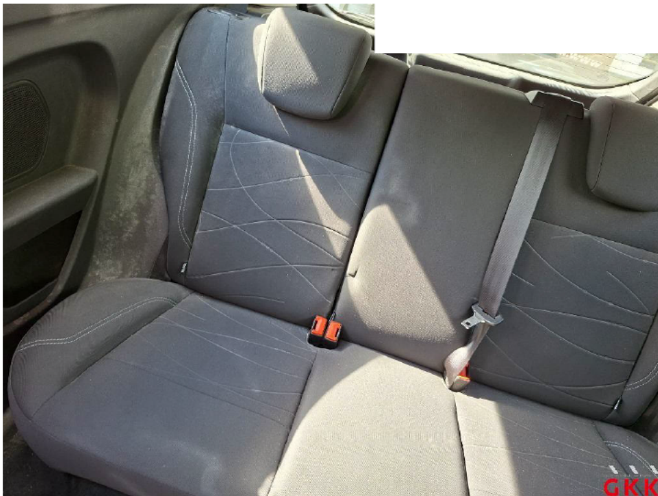
Bild 33 Fahrzeug, innen, verkratzt und verschmutzt, aufbereiten