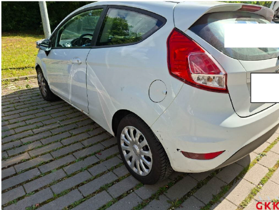
Bild 17 Fahrzeug, Seite links, Unfallschaden, Unfallschaden beheben