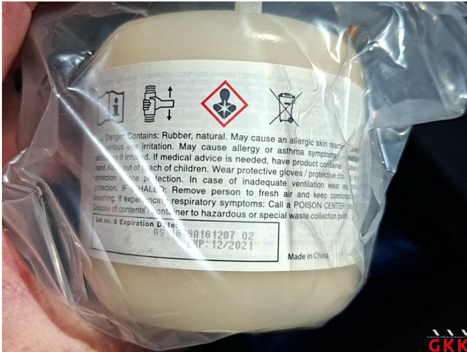
Bild 13 Reifenreparaturset, Füllflasche, MHD überschritten, ersetzen