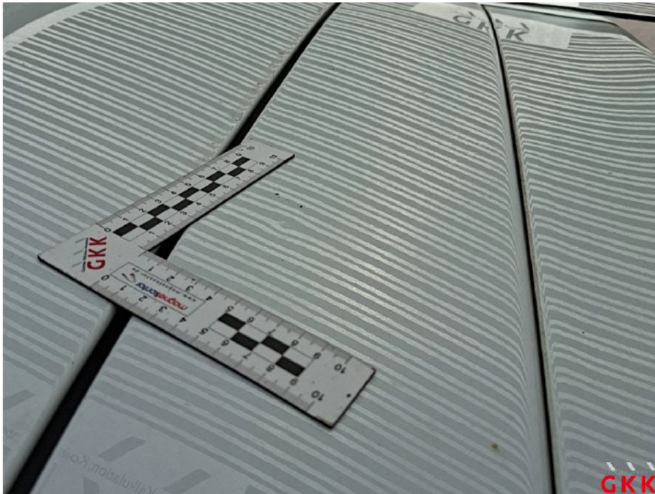
Bild 29 Heckklappe, bis 3 Dellen / Bauteil, kalt drücken