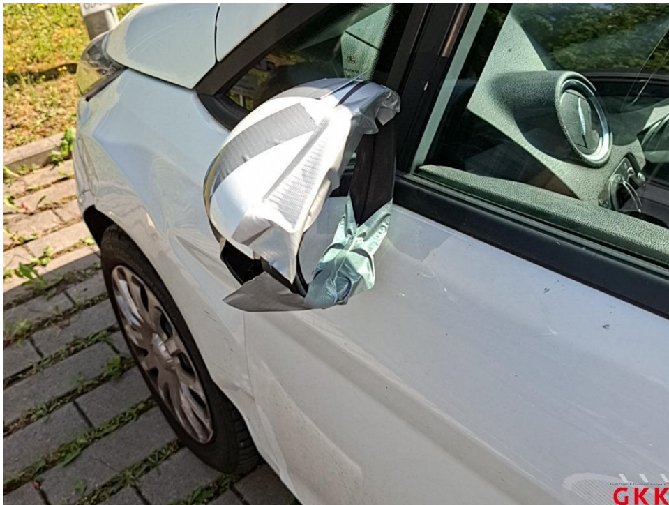
Bild 20 Fahrzeug, Seite links, Unfallschaden, Unfallschaden beheben