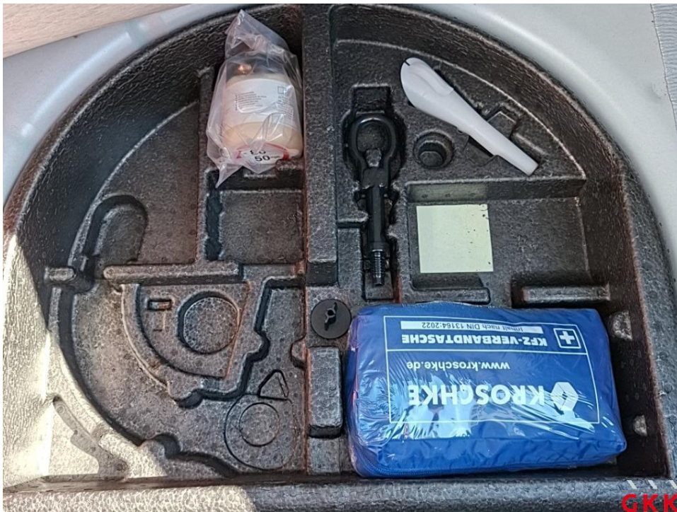
Bild 14 Reifenreparaturset, Füllkompressor, fehlt, ersetzen