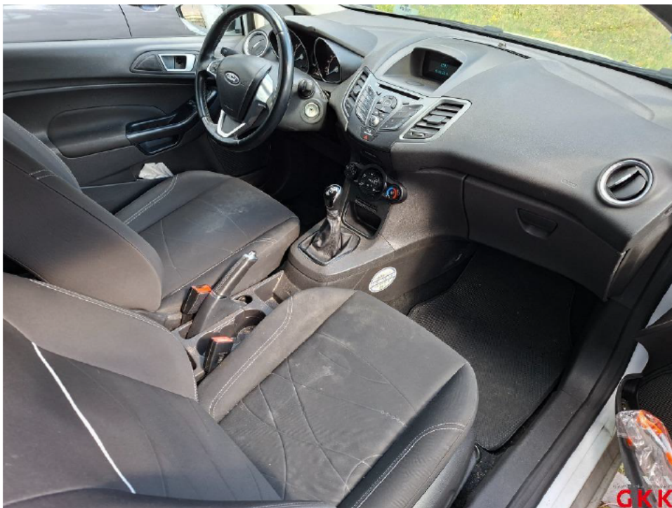
Bild 32 Fahrzeug, innen, verkratzt und verschmutzt, aufbereiten