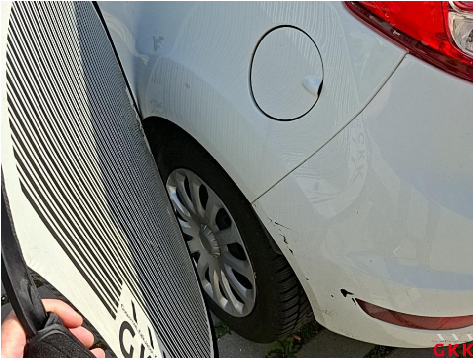
Bild 21 Fahrzeug, Seite links, Unfallschaden, Unfallschaden beheben