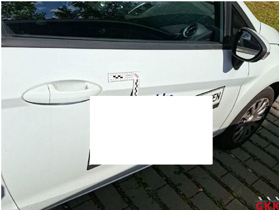
Bild 30 Tür vorne rechts, verkratzt, lackieren