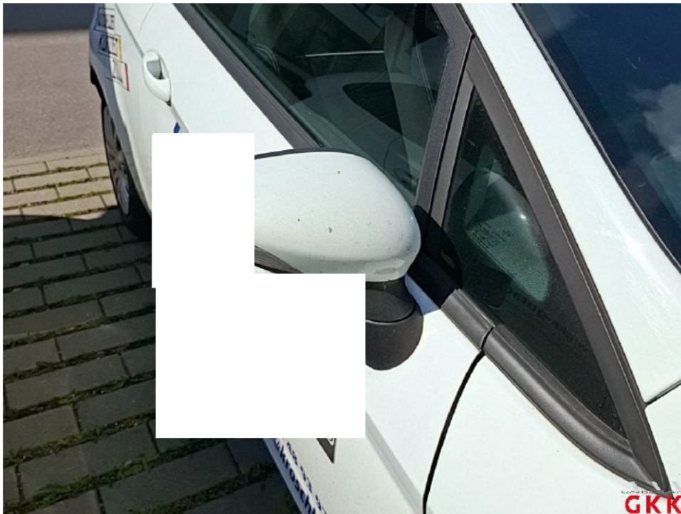
Bild 24 Spiegelgehäuse rechts, Kappe -lackiert-, verkratzt, lackieren