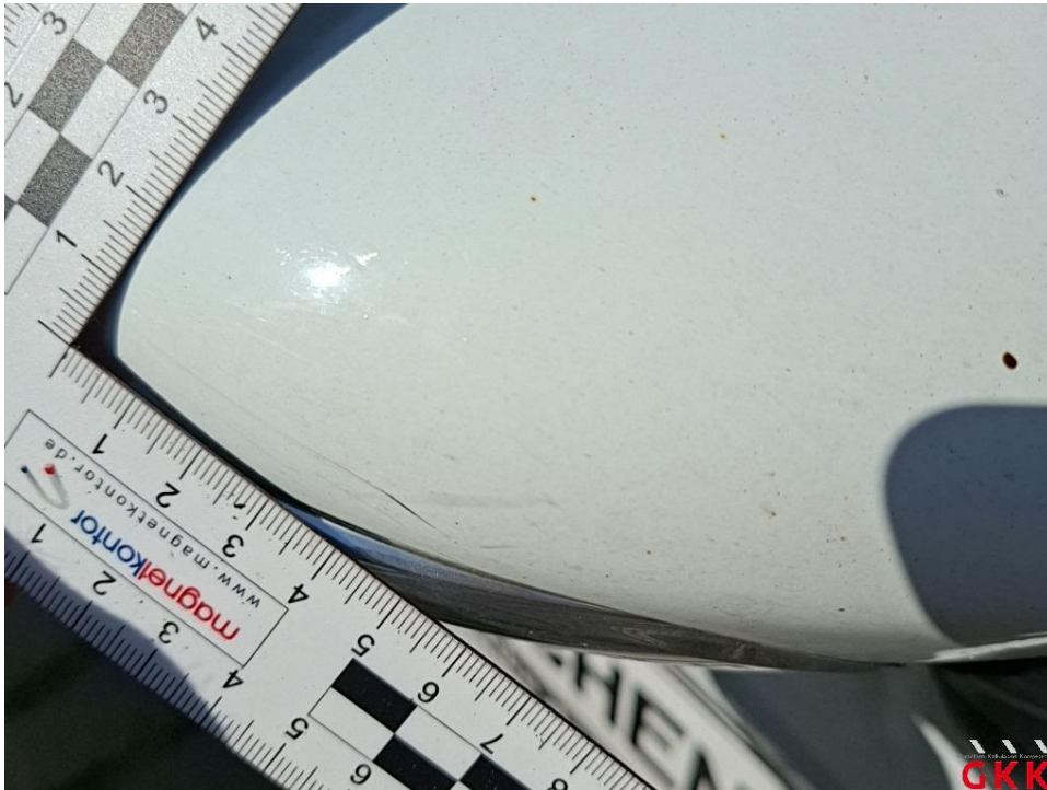
Bild 25 Spiegelgehäuse rechts, Kappe -lackiert-, verkratzt, lackieren