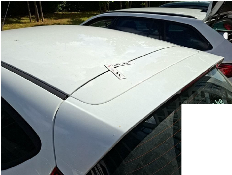
Bild 28 Heckklappe, bis 3 Dellen / Bauteil, kalt drücken