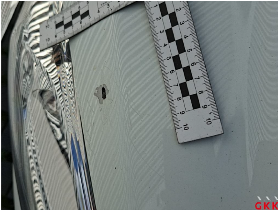
Bild 27 Motorhaube, beschädigt, instand setzen - lackieren