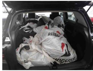
Räder - eingelegt im Fahrzeug