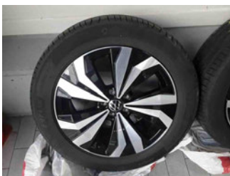
Räder - Rad beiliegend #1