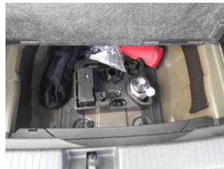
Räder - Haltbarkeitsdatum Tirefit