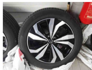
Räder - Rad beiliegend #3