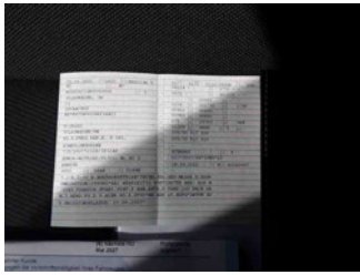
Fahrzeug - abgegebene ZB1