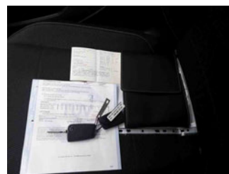
Equipment - Boardmappe/ Securitybag