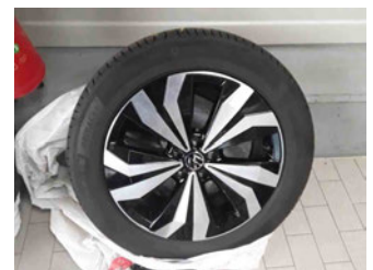
Räder - Rad beiliegend #4