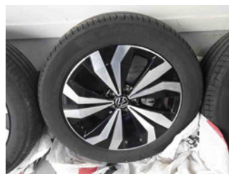
Räder - Rad beiliegend #2