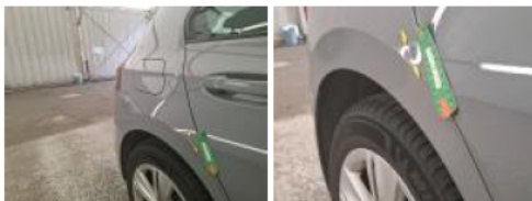
Porte ARD, Griffe(s), 67 - Lustrage