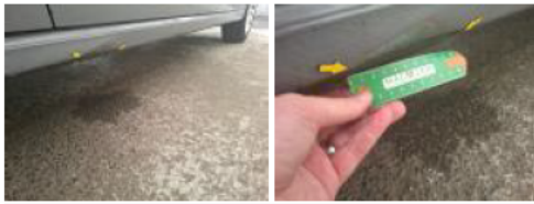
Porte ARG, Bosse(s), LI - Réparer et peindre (complet)