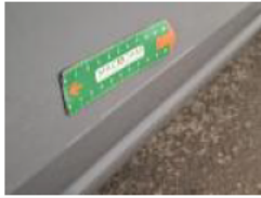
Boitier rétroviseur ext D, Griffe(s), Peindre