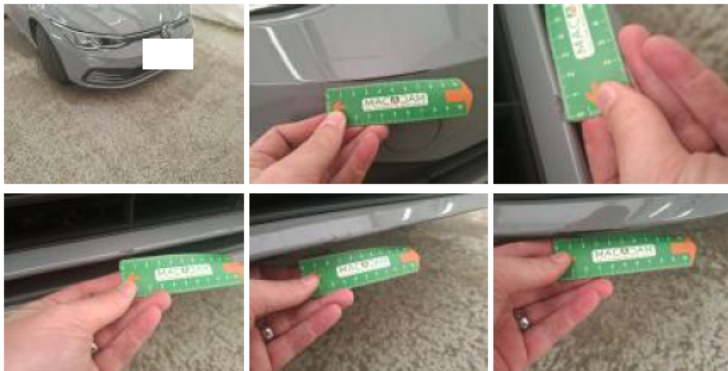
Grille de pare-chocs AV M, Cassé, E - Remplacer