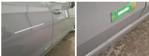
Porte AVD, Griffe(s), 67 - Lustrage