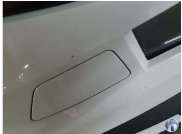
2. Stoßfänger Vorne Gebrauchsspuren - Ohne Reparatur