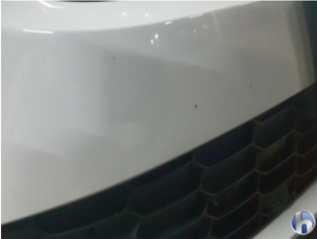
2. Stoßfänger Vorne Gebrauchsspuren - Ohne Reparatur