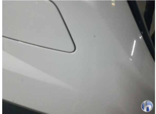
2. Stoßfänger Vorne Gebrauchsspuren - Ohne Reparatur