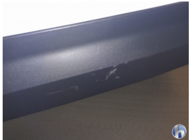
1. Stoßfänger Hinten Kratzer - Smart Repair