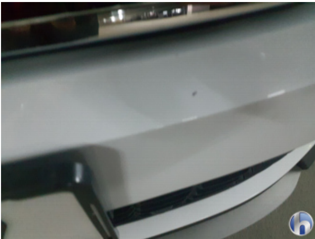
2. Stoßfänger Vorne Gebrauchsspuren - Ohne Reparatur