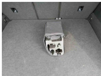
Equipment - Bordwerkzeug