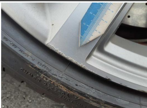
LM-Felge vorne rechts verkratz, verschürft