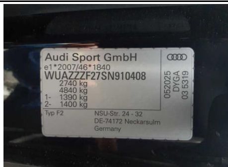
Ansicht Typschild / VIN