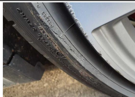
Reifen vorne rechts Flanke eingerissen