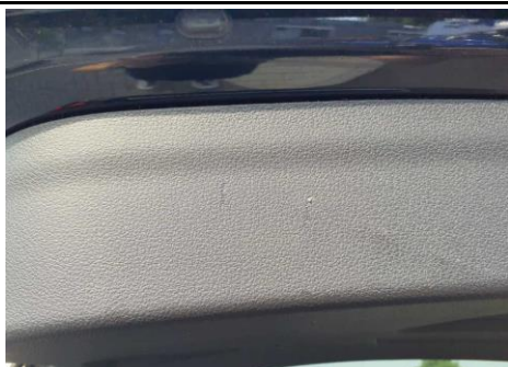
Verkleidung Heckklappe innen verkratzt