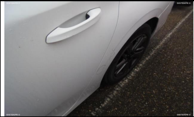
Foto daños externos 1