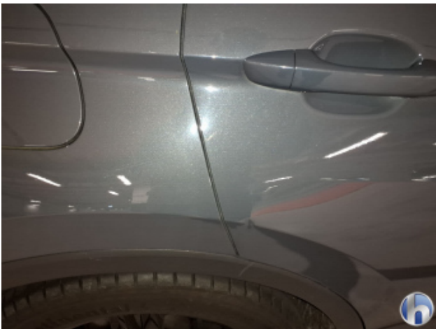
1. Tür Hinten - Rechts Verdellt - Sanft Instandsetzen