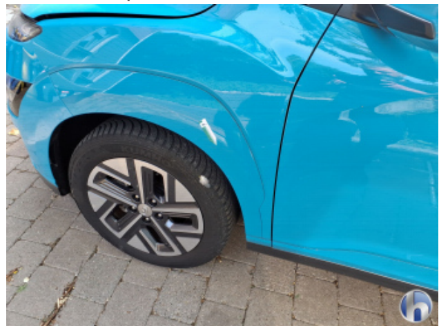
3. Kotflügel Vorne - Links Kratzer - Smart Repair