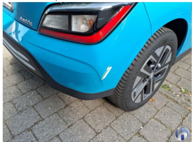
4. Stoßfänger Hinten Kratzer - Smart Repair