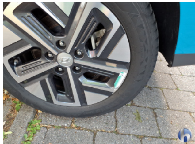
1. Felge Hinten - Links Kratzer - Smart Repair