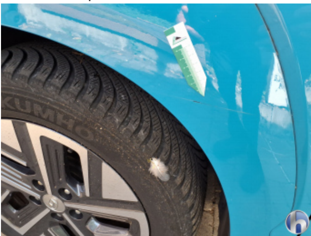
3. Kotflügel Vorne - Links Kratzer - Smart Repair