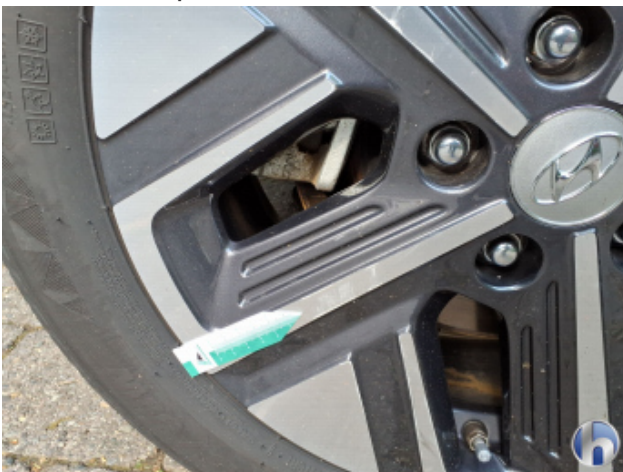
2. Felge Hinten - Rechts Kratzer - Smart Repair