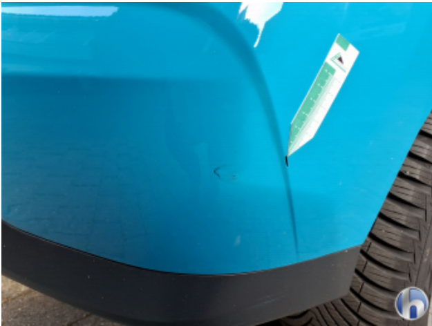
4. Stoßfänger Hinten Kratzer - Smart Repair