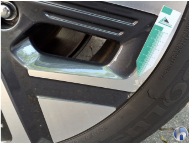
1. Felge Hinten - Links Kratzer - Smart Repair