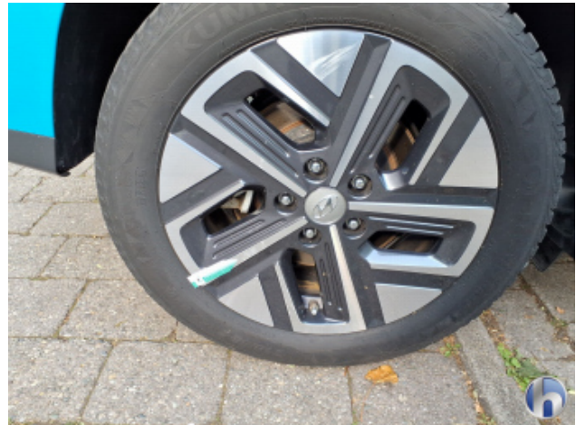
2. Felge Hinten - Rechts Kratzer - Smart Repair