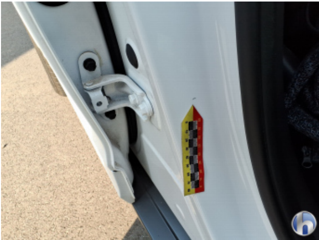
2. Türeinstieg Vorne - Rechts Gebrauchsspuren - Ohne Reparatur