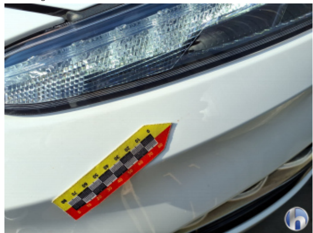
1. Stoßfänger Vorne Gebrauchsspuren - Ohne Reparatur