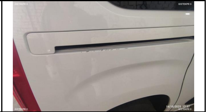
ALETA TRASERA DERECHA