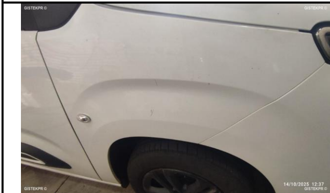
ALETA DL DR