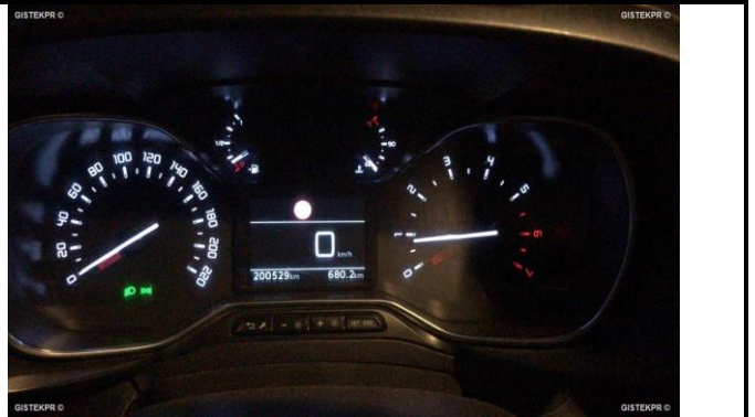
CUADRO DE INSTRUMENTOS