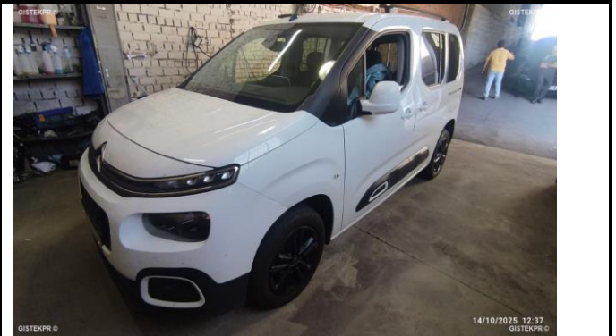
FFLTI IMG 20251014_123729