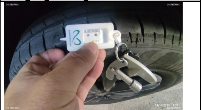
NEUMATICO DL IZ