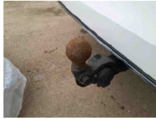
Equipment - Anhängerkupplung