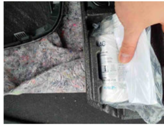
Räder - Haltbarkeitsdatum Tirefit