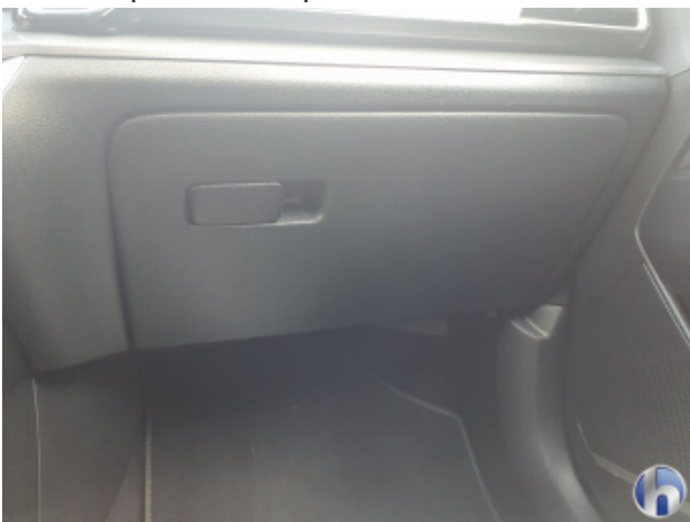
3. Armaturenbrett Gebrauchsspuren - Ohne Reparatur