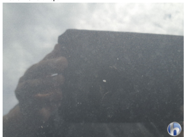
2. Motorhaube Gebrauchsspuren - Ohne Reparatur