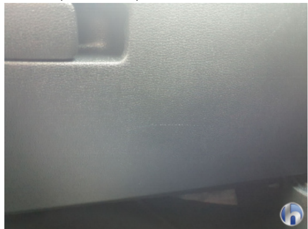
3. Armaturenbrett Gebrauchsspuren - Ohne Reparatur