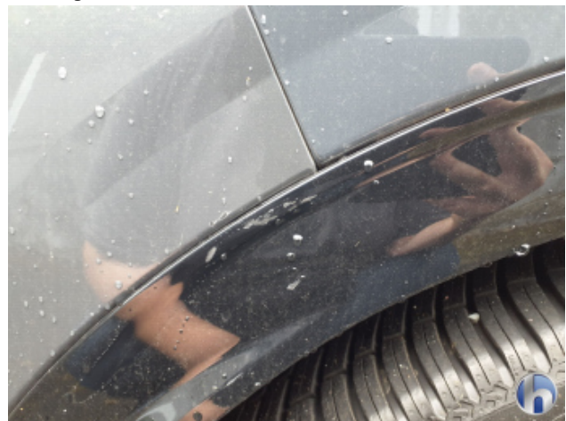
1. Seitenwand - Hinten - Rechts Kratzer - Smart Repair