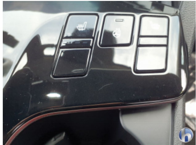
4. Mittelkonsole Innenraum vorne mitte Gebrauchsspuren - Ohne Reparatur