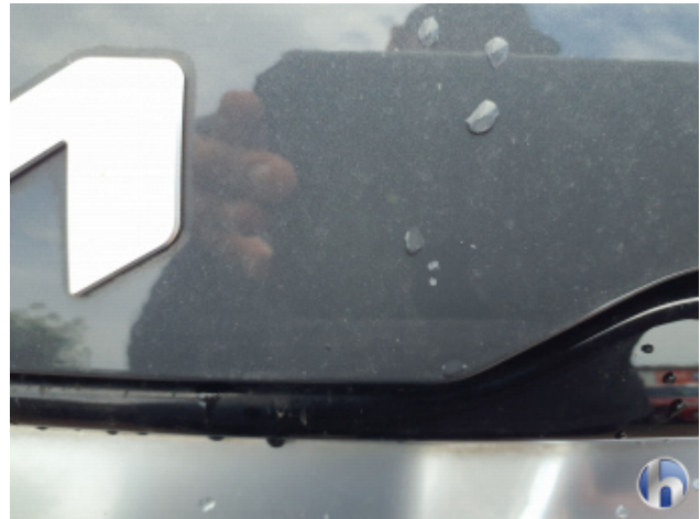
2. Motorhaube Gebrauchsspuren - Ohne Reparatur