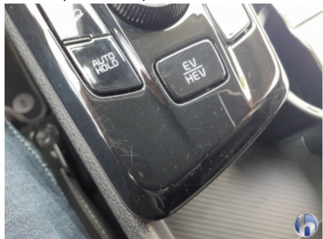
4. Mittelkonsole Innenraum vorne mitte Gebrauchsspuren - Ohne Reparatur