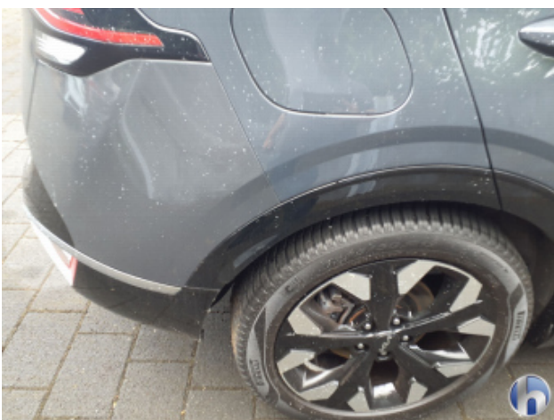
1. Seitenwand - Hinten - Rechts Kratzer - Smart Repair