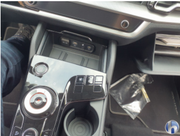
4. Mittelkonsole Innenraum vorne mitte Gebrauchsspuren - Ohne Reparatur