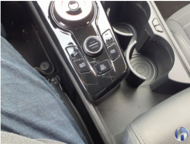
4. Mittelkonsole Innenraum vorne mitte Gebrauchsspuren - Ohne Reparatur