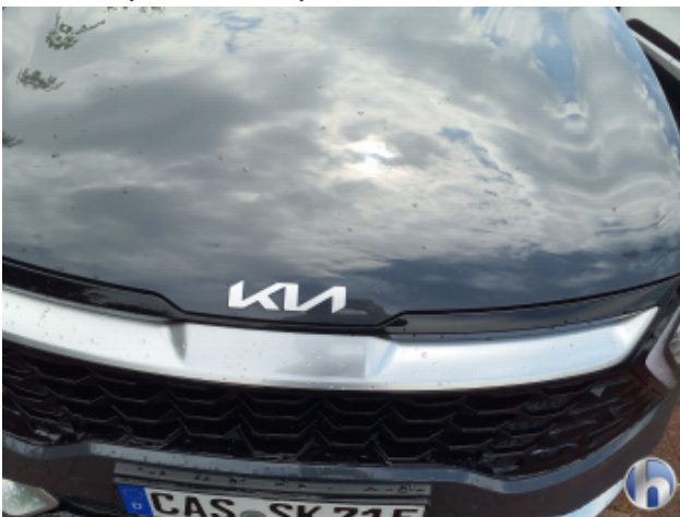
2. Motorhaube Gebrauchsspuren - Ohne Reparatur