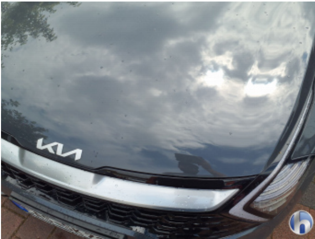
2. Motorhaube Gebrauchsspuren - Ohne Reparatur