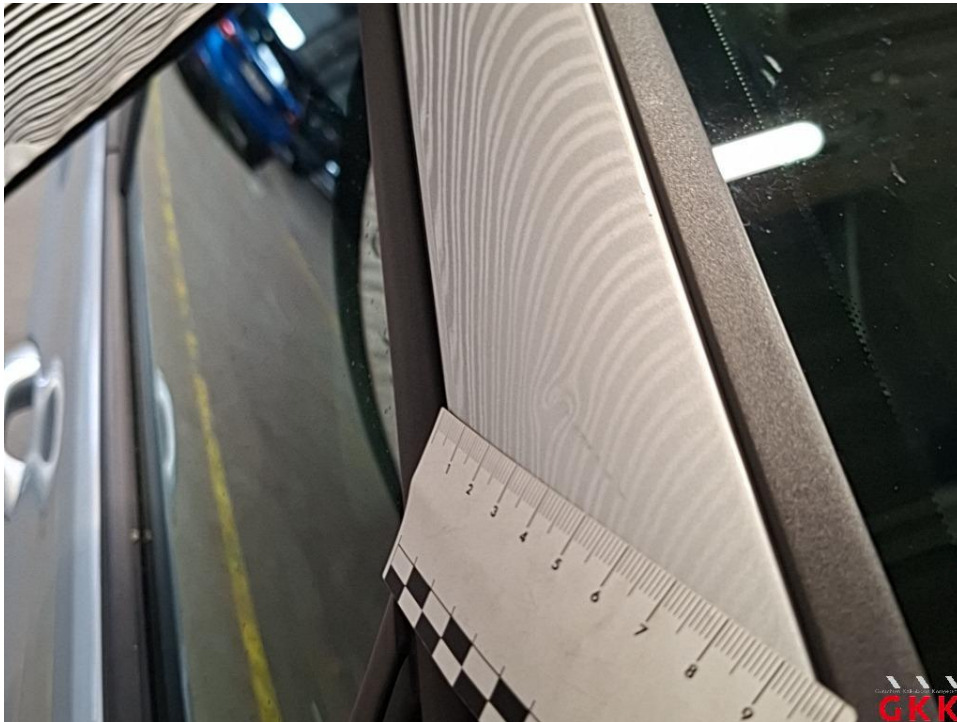
Bild 19 A- Säule rechts, beschädigt, Smartrepair