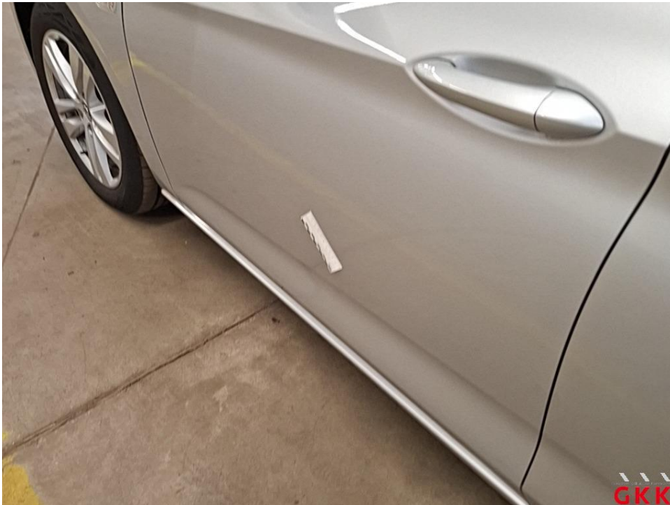
Bild 15 Tür vorne links, beschädigt, instand setzen - lackieren