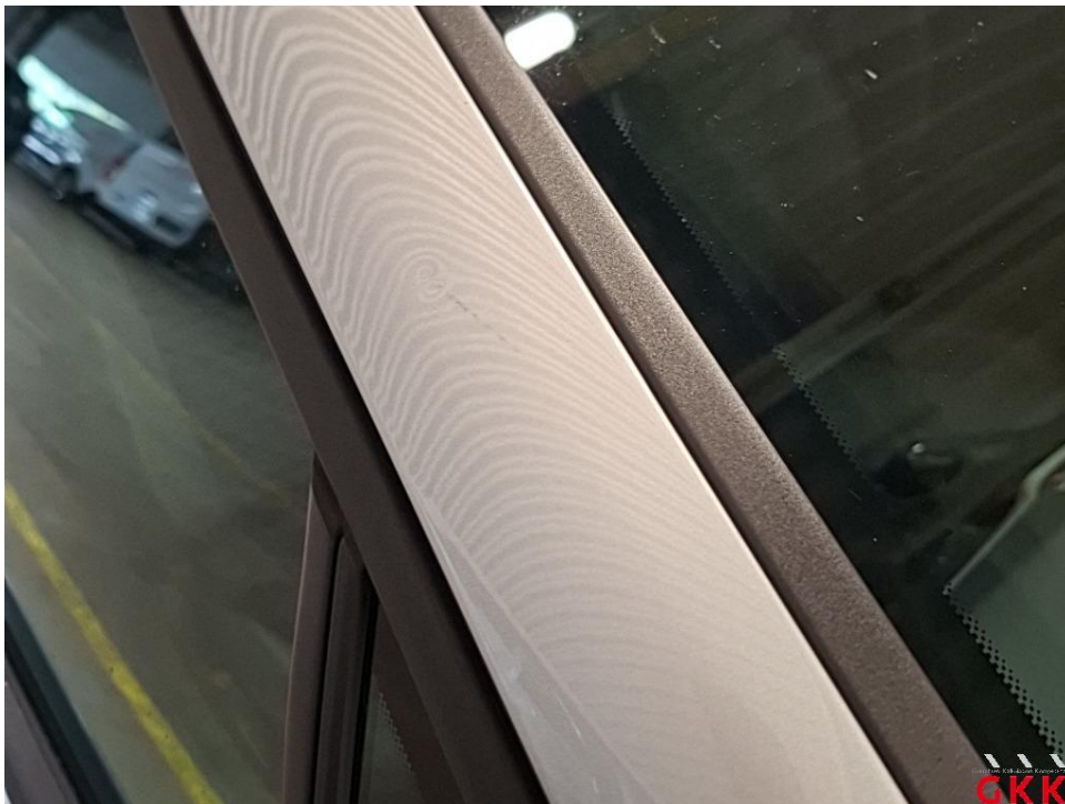
Bild 18 A- Säule rechts, beschädigt, Smartrepair