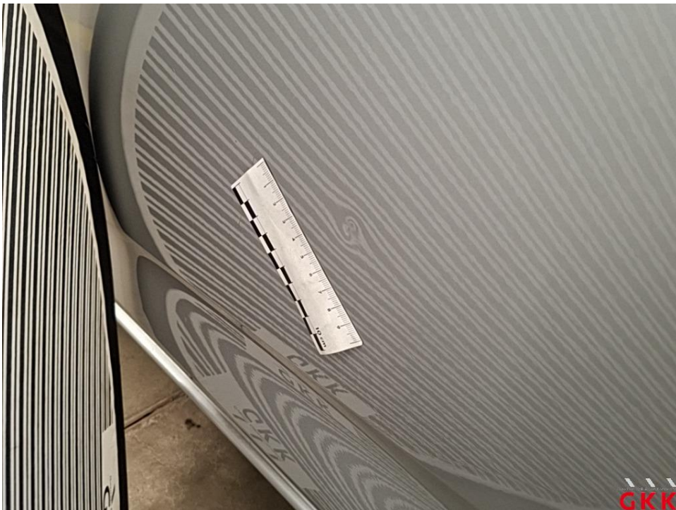
Bild 16 Tür vorne links, beschädigt, instand setzen - lackieren