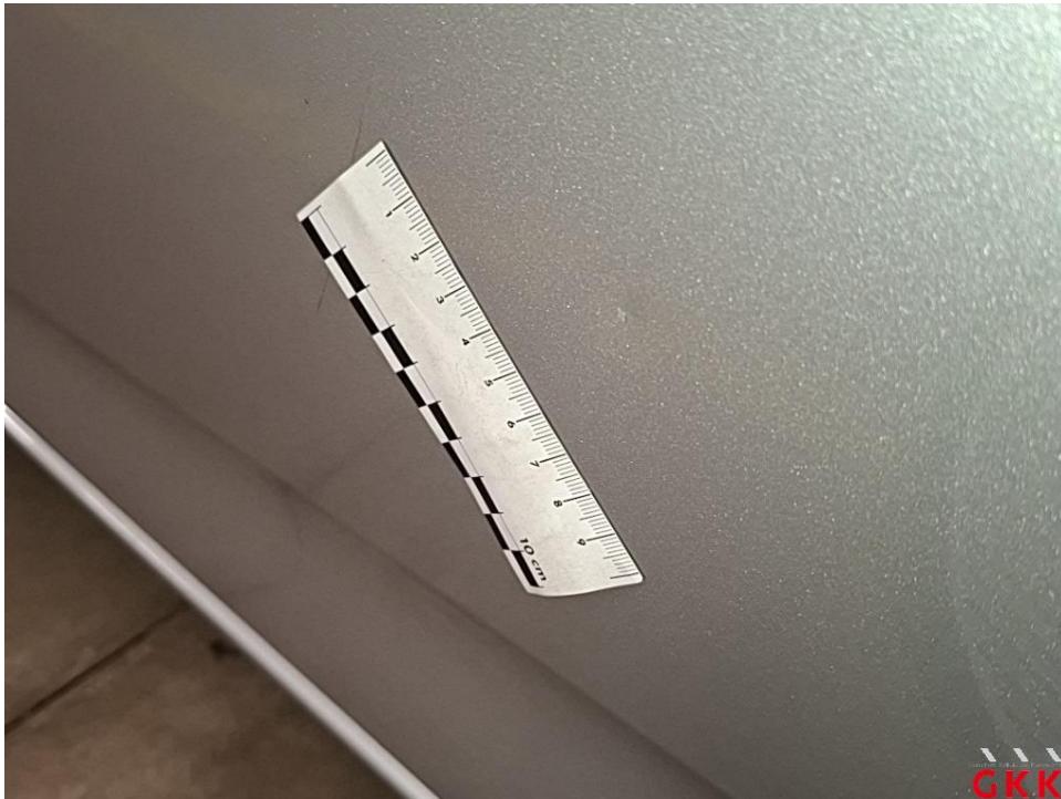
Bild 17 Tür vorne links, beschädigt, instand setzen - lackieren