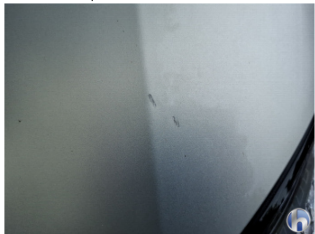
3. Motorhaube Kratzer - Lackieren