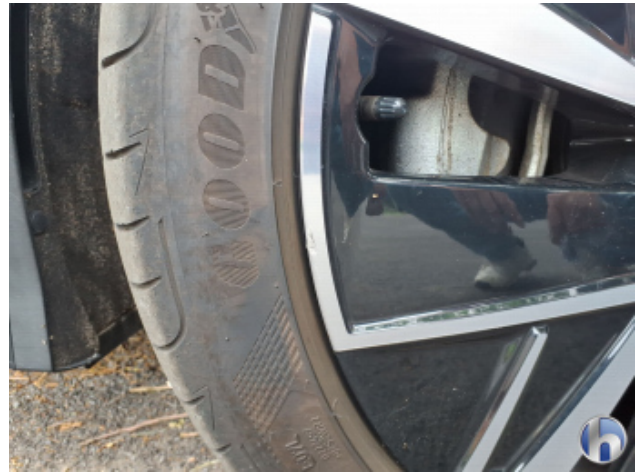
1. Felge Vorne - Links Kratzer - Smart Repair