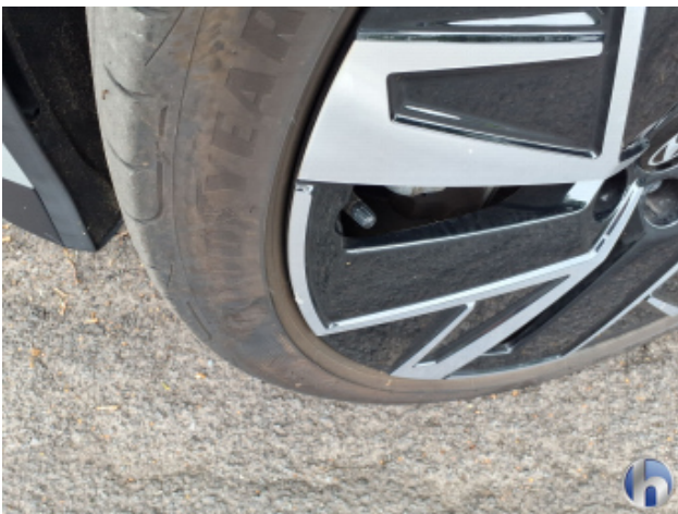
1. Felge Vorne - Links Kratzer - Smart Repair