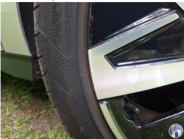
2. Felge Vorne - Rechts Kratzer - Smart Repair