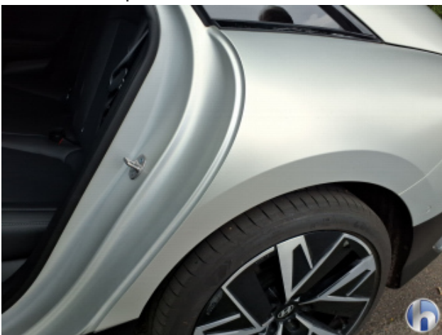
5. Seitenwand - Hinten - Links Gebrauchsspuren - Ohne Reparatur