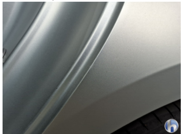
5. Seitenwand - Hinten - Links Gebrauchsspuren - Ohne Reparatur