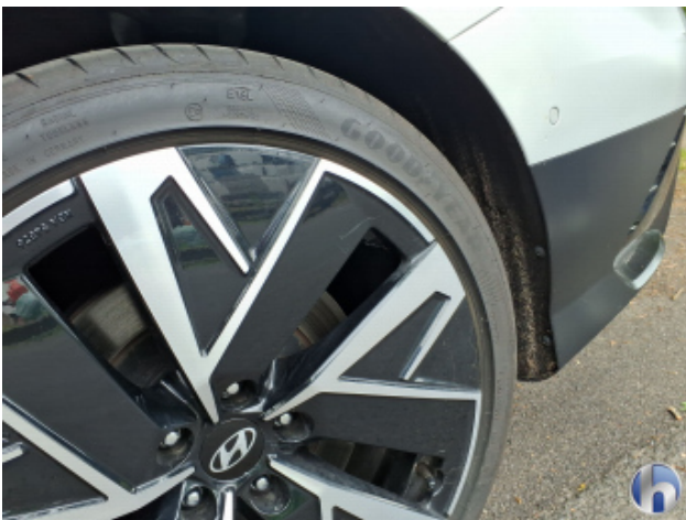
4. Felge Hinten - Links Kratzer - Smart Repair