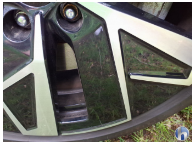
2. Felge Vorne - Rechts Kratzer - Smart Repair