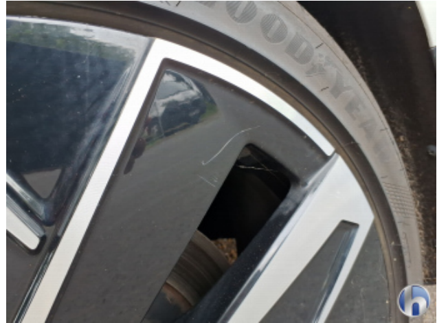
4. Felge Hinten - Links Kratzer - Smart Repair