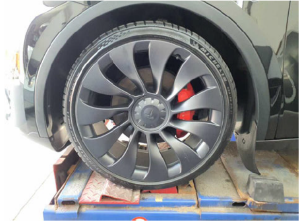
Abbildung 14: Montierte Bereifung