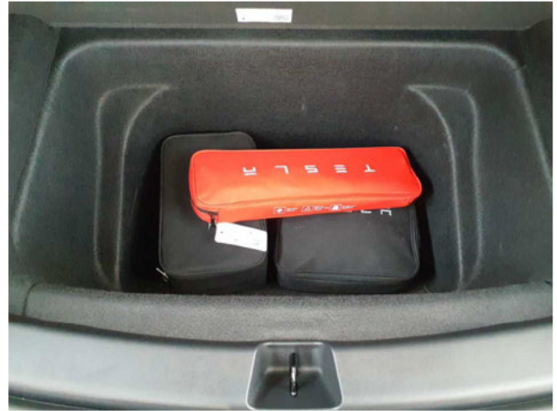
Abbildung 16: Sonstiges