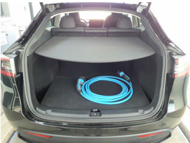
Abbildung 5: Laderaum