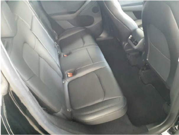
Abbildung 13: Innenraum hinten