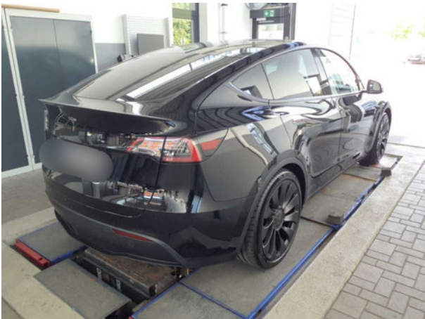
Abbildung 3: Schräg hinten