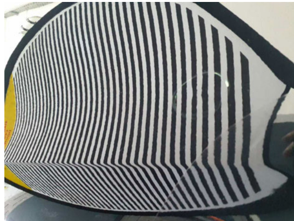
Beschädigung #1: Tür hinten links: Tür - Delle(n) - sanft instandsetzen