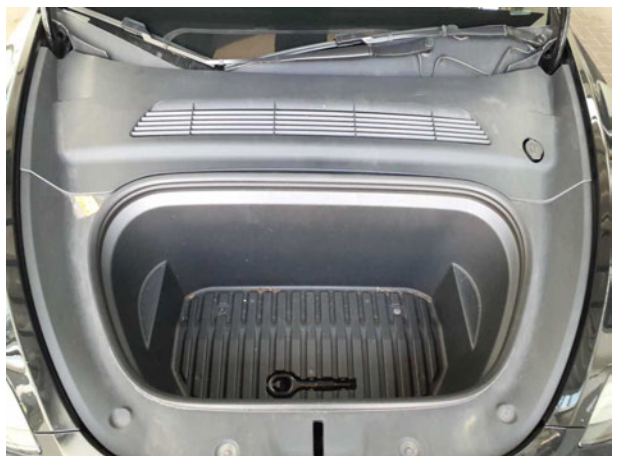
Abbildung 6: Motorraum