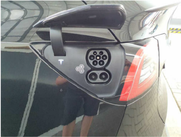
Abbildung 15: Ladebuchse/Tankstutzen