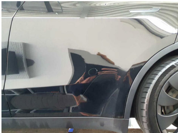
Beschädigung #1: Tür hinten links: Tür - Delle(n) - sanft instandsetzen