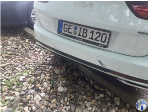
2. Stoßfänger Hinten Lackabplatzer - Lackieren