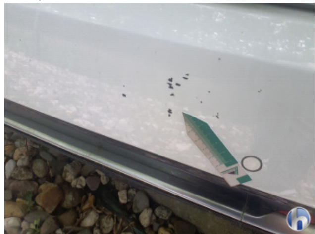
2. Stoßfänger Hinten Lackabplatzer - Lackieren