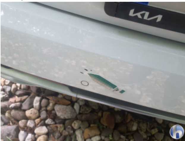
2. Stoßfänger Hinten Lackabplatzer - Lackieren