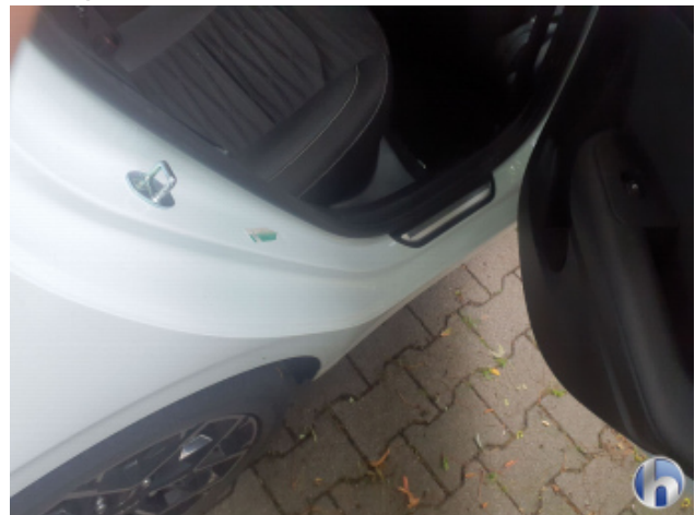
3. Türeinstieg Hinten - Rechts Delle - Sanft Instandsetzen