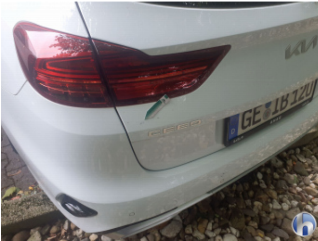
1. Heckklappe Lackabplatzer - Lackieren