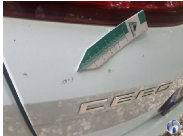
1. Heckklappe Lackabplatzer - Lackieren