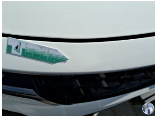
1. Motorhaube Gebrauchsspuren - Ohne Reparatur