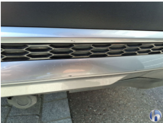
2. Stoßfänger Hinten Kratzer - Smart Repair