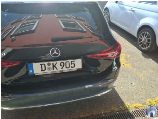
1. Stoßfänger Hinten Kratzer - Smart Repair