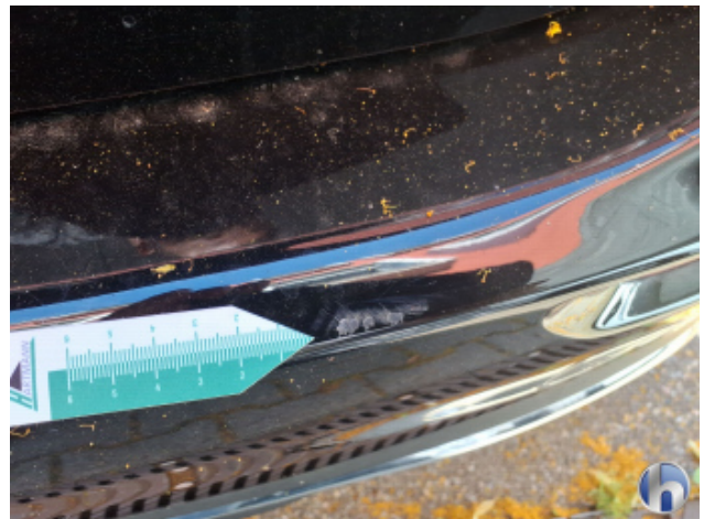
1. Stoßfänger Hinten Kratzer - Smart Repair