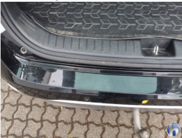
12. Verkleidung Verschmutzt - Reinigen