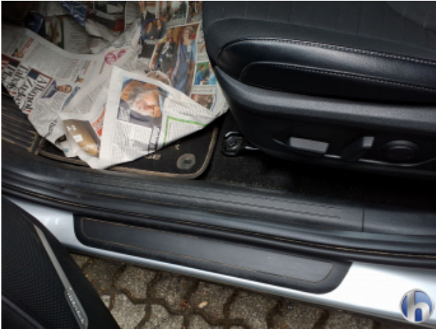
12. Verkleidung Verschmutzt - Reinigen