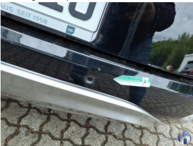
9. Stoßfänger Hinten Kratzer - Lackieren