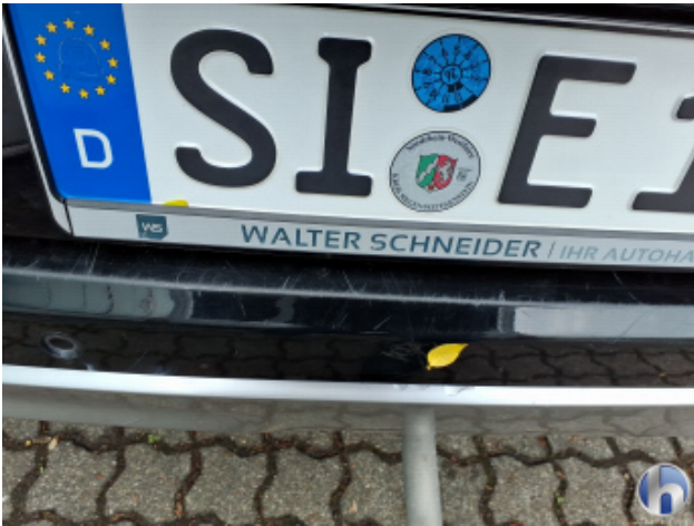
9. Stoßfänger Hinten Kratzer - Lackieren