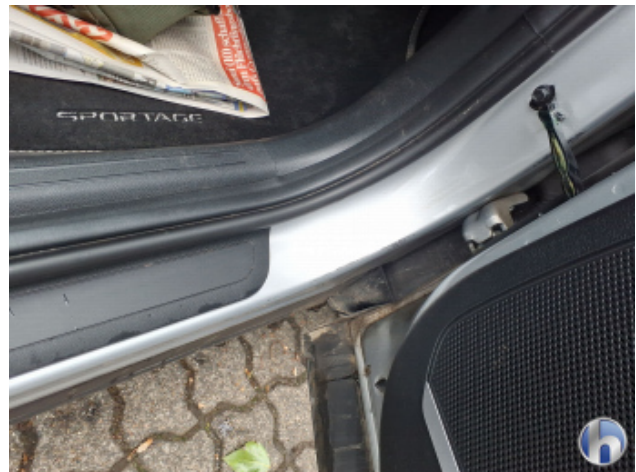
12. Verkleidung Verschmutzt - Reinigen