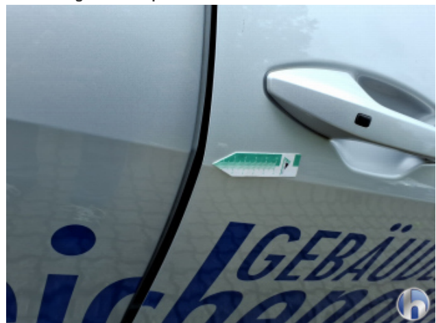
7. Tür Vorne - Rechts Kratzer - Smart Repair