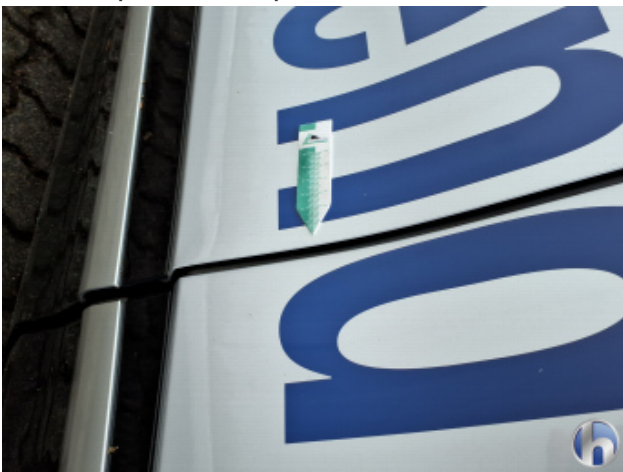
3. Tür Vorne - Links Kratzer - Smart Repair