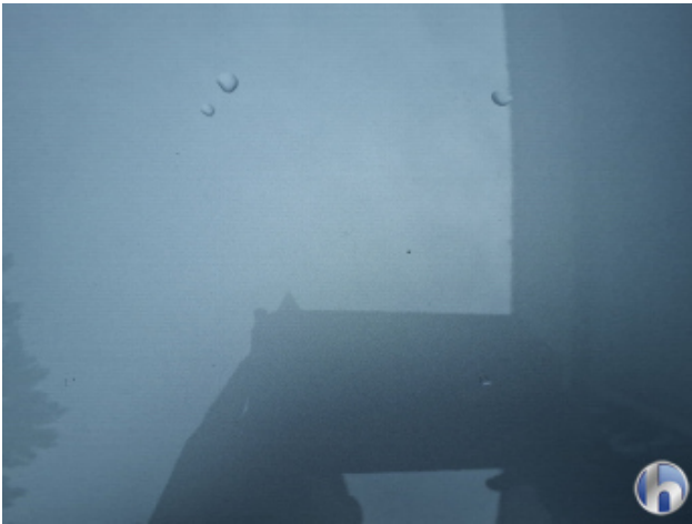
6. Motorhaube Steinschlag - Ohne Reparatur