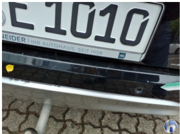
9. Stoßfänger Hinten Kratzer - Lackieren