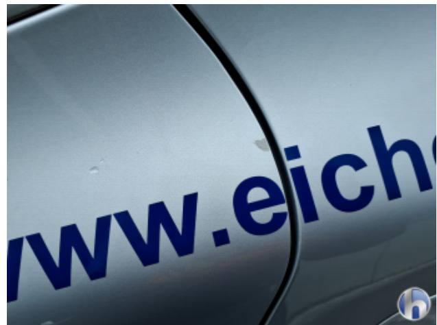
10. Tür Hinten - Links Kratzer - Smart Repair