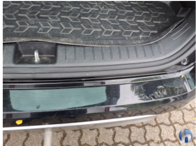
12. Verkleidung Verschmutzt - Reinigen