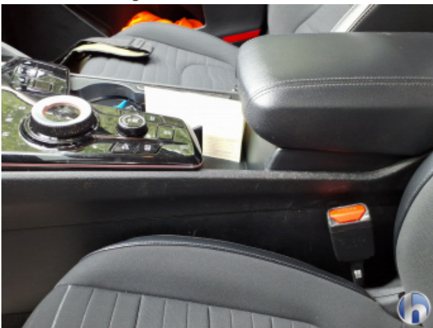
12. Verkleidung Verschmutzt - Reinigen