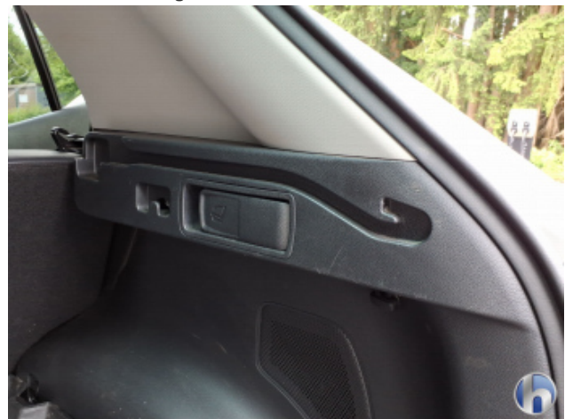
12. Verkleidung Verschmutzt - Reinigen