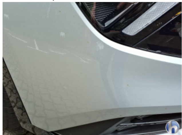
5. Stoßfänger Vorne Steinschlag - Ohne Reparatur