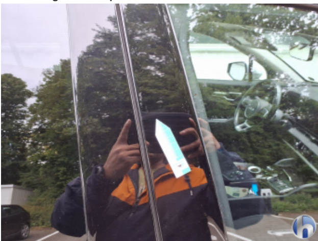
7. Tür Vorne - Rechts Kratzer - Smart Repair