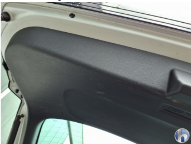
12. Verkleidung Verschmutzt - Reinigen