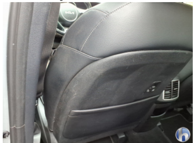
12. Verkleidung Verschmutzt - Reinigen