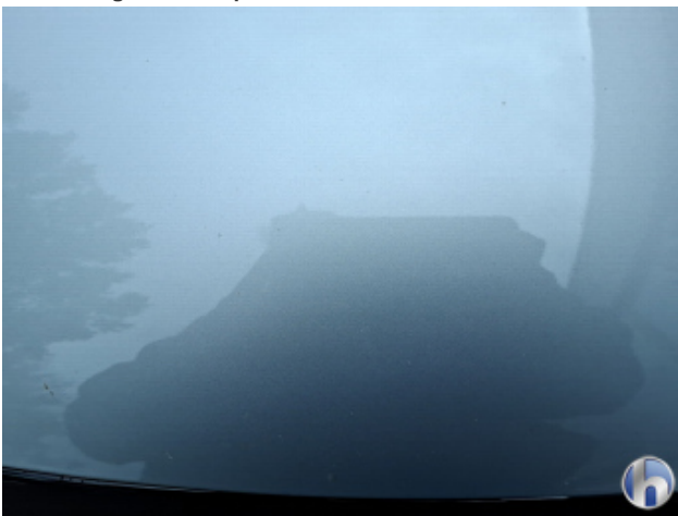
6. Motorhaube Steinschlag - Ohne Reparatur