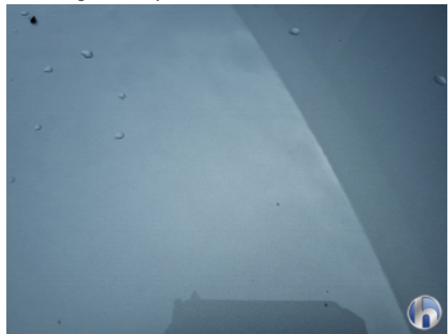
6. Motorhaube Steinschlag - Ohne Reparatur