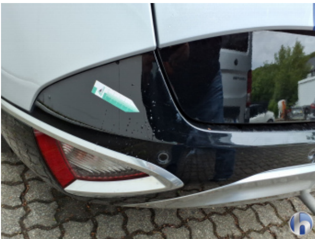
9. Stoßfänger Hinten Kratzer - Lackieren