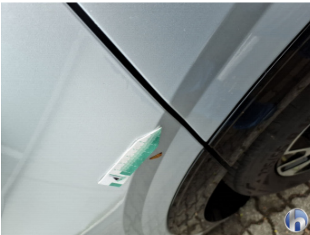
10. Tür Hinten - Links Kratzer - Smart Repair