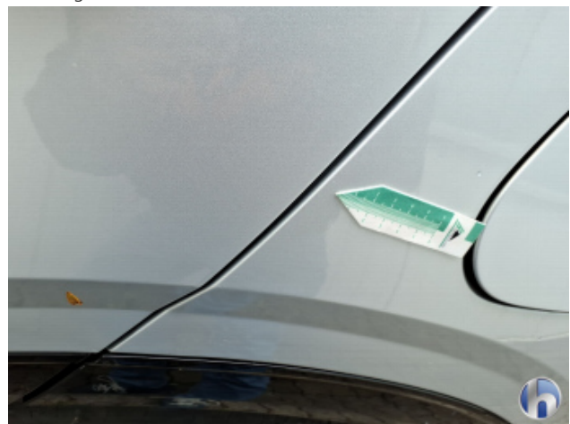
1. Seitenwand - Hinten - Links Gebrauchsspuren - Ohne Reparatur