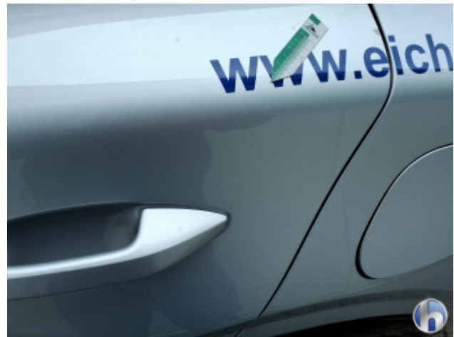
10. Tür Hinten - Links Kratzer - Smart Repair