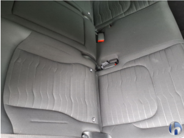
13. Sitz Innenraum rechts hinten Verschmutzt - Reinigen