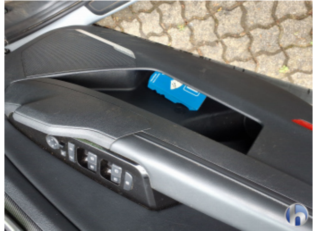
12. Verkleidung Verschmutzt - Reinigen