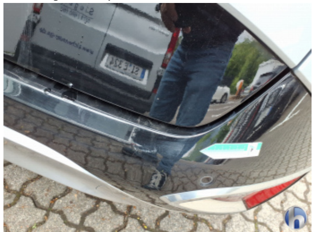
9. Stoßfänger Hinten Kratzer - Lackieren