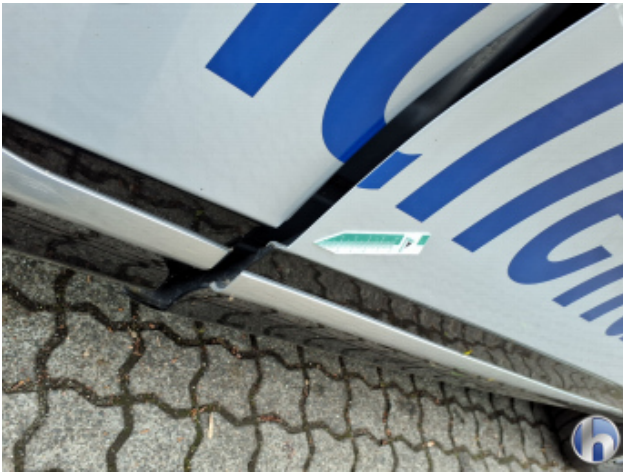
7. Tür Vorne - Rechts Kratzer - Smart Repair