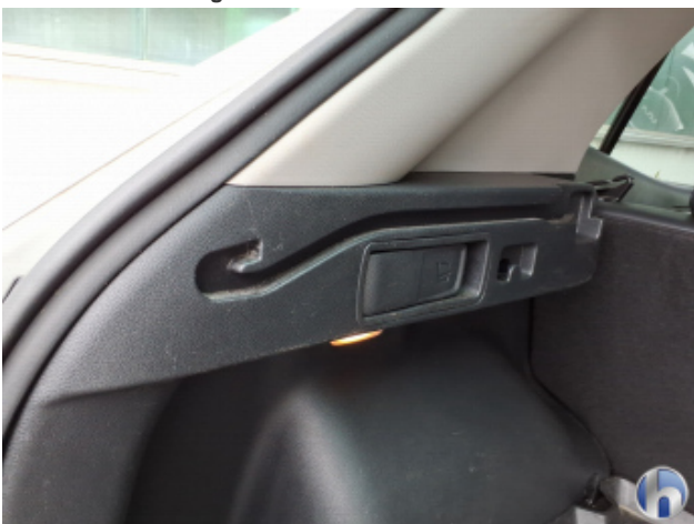
12. Verkleidung Verschmutzt - Reinigen