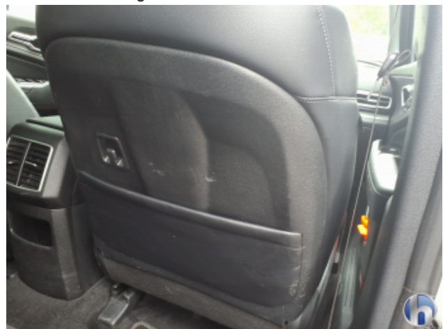
12. Verkleidung Verschmutzt - Reinigen