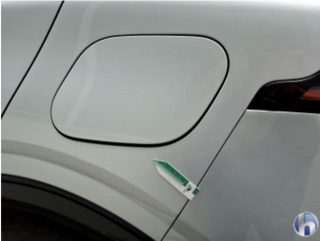
2. Seitenwand - Hinten - Links Gebrauchsspuren - Ohne Reparatur