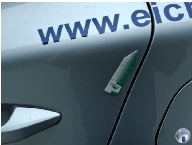
10. Tür Hinten - Links Kratzer - Smart Repair