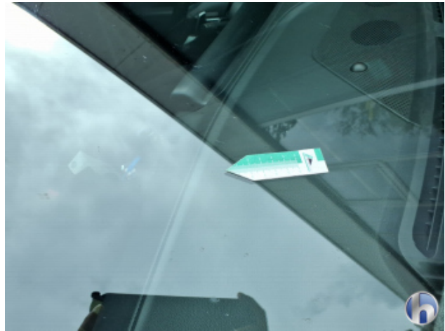
8. Windschutzscheibe Steinschlag - Ohne Reparatur