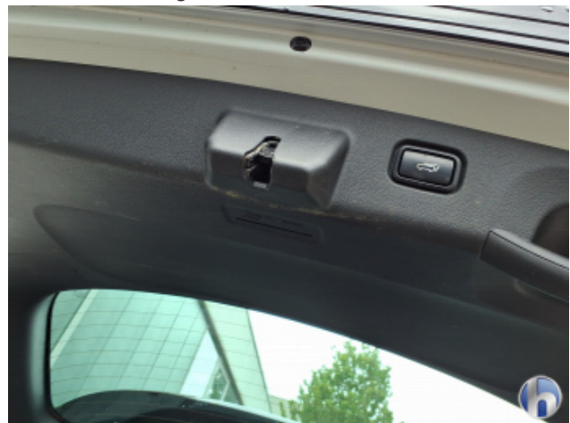
12. Verkleidung Verschmutzt - Reinigen