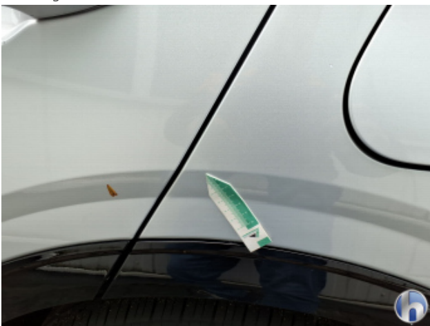
1. Seitenwand - Hinten - Links Gebrauchsspuren - Ohne Reparatur