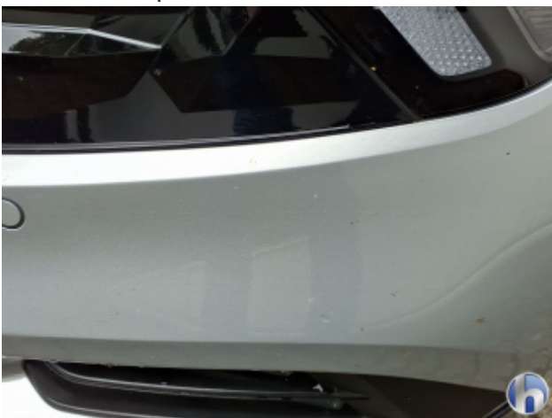
5. Stoßfänger Vorne Steinschlag - Ohne Reparatur