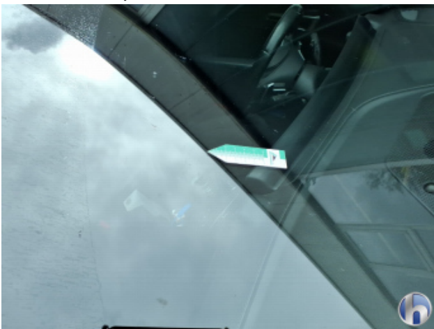
8. Windschutzscheibe Steinschlag - Ohne Reparatur