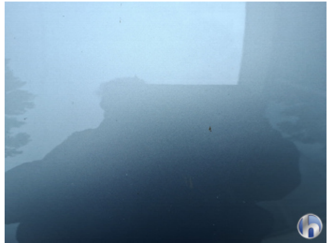
6. Motorhaube Steinschlag - Ohne Reparatur