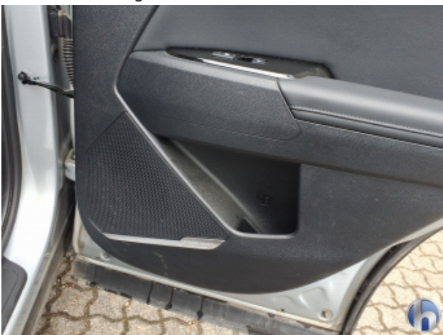
12. Verkleidung Verschmutzt - Reinigen