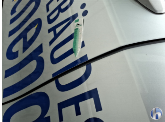
3. Tür Vorne - Links Kratzer - Smart Repair