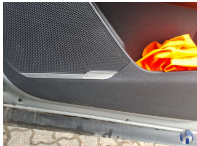
12. Verkleidung Verschmutzt - Reinigen