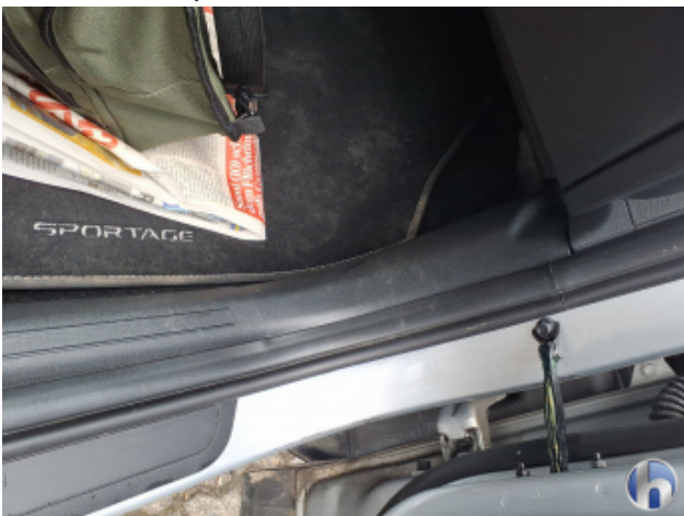
12. Verkleidung Verschmutzt - Reinigen