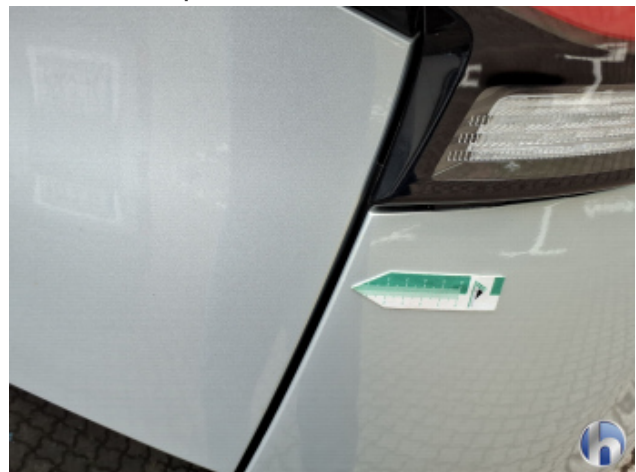
4. Seitenwand - Hinten - Rechts Kratzer - Smart Repair