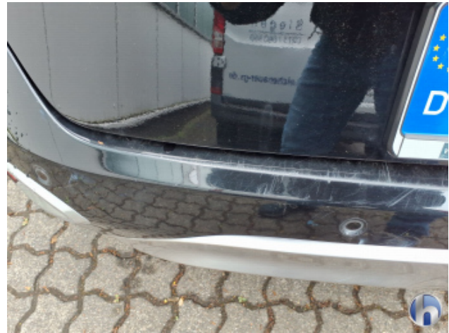
9. Stoßfänger Hinten Kratzer - Lackieren