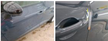
Porte ARG, Griffe(s), Peindre