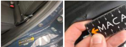
Porte AVG, Bosse(s), PDR - Débosselage ss peinture