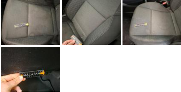
Revêtement assise ARD, Brûlé, Smart repair