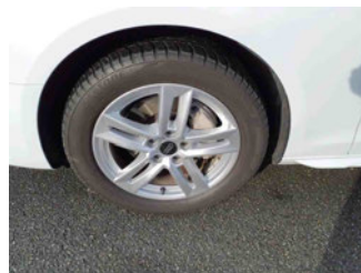
Räder - Rad montiert vorne links