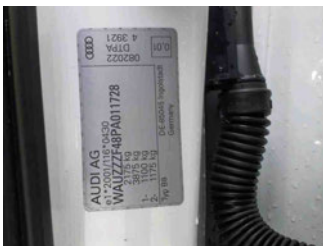
Fahrzeug - Typenschild/Fahrgestellnummer