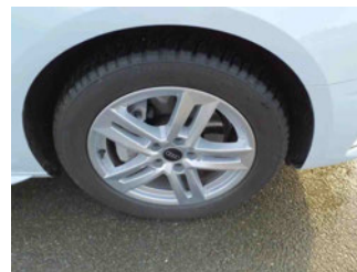
Räder - Rad montiert vorne rechts