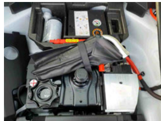
Equipment - Bordwerkzeug