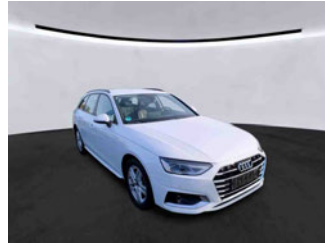
Fahrzeugansicht - diagonal vorne rechts