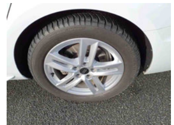
Räder - Rad montiert hinten links