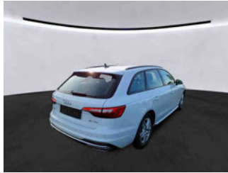
Fahrzeugansicht - diagonal hinten rechts