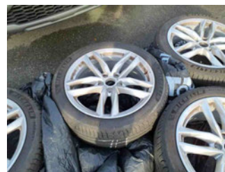
Räder - Rad beiliegend #2