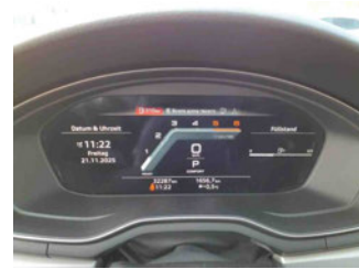
Innenraum - Cockpit mit Laufleistung