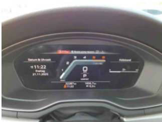
Innenraum - Cockpit mit Laufleistung