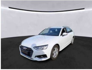
Fahrzeugansicht - diagonal vorne links