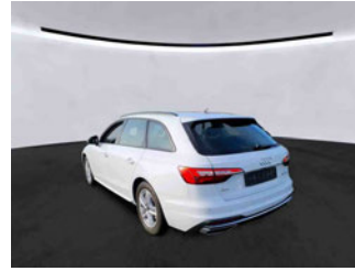
Fahrzeugansicht - diagonal hinten links