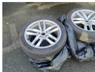
Räder - Rad beiliegend #1