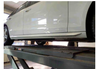
Seitenansicht - Schweller rechts