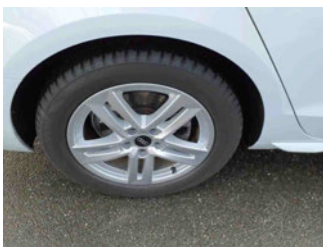
Räder - Rad montiert hinten rechts