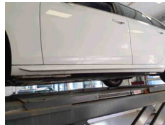
Seitenansicht - Schweller links