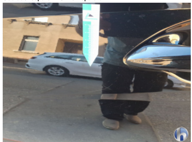
4. Tür Hinten - Links Kratzer - Smart Repair