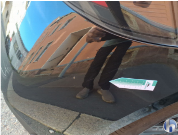
1. Stoßfänger Hinten Kratzer - Smart Repair