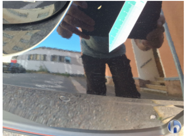
1. Stoßfänger Hinten Kratzer - Smart Repair