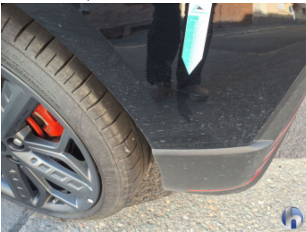
1. Stoßfänger Hinten Kratzer - Smart Repair