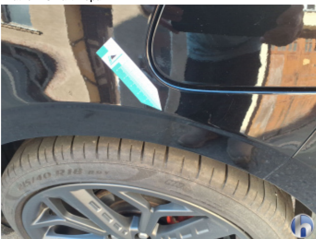
3. Seitenwand - Hinten - Links Oberflächenkratzer - Aufbereiten / Polieren