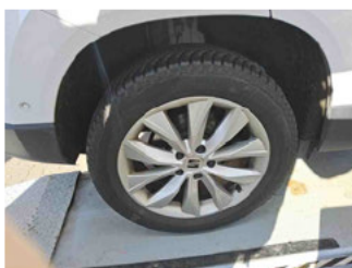
Räder - Rad montiert hinten rechts