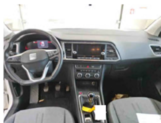
Innenraum - Mittelkonsole