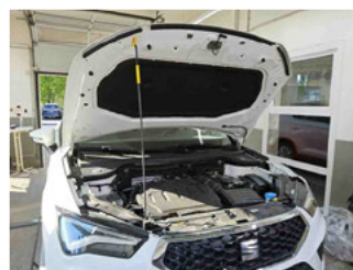
Fahrzeug - Motorraum offen