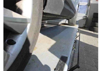
Seitenansicht - Schweller rechts