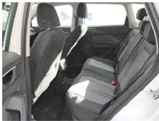
Innenraum - hinten