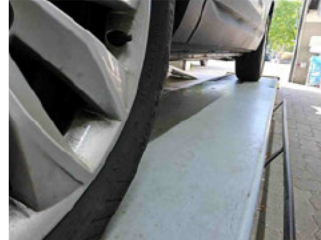
Seitenansicht - Schweller links