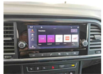
Innenraum - Navigationsgerät/Radio