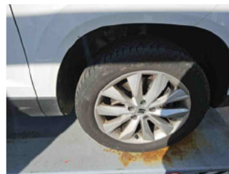
Räder - Rad montiert vorne rechts