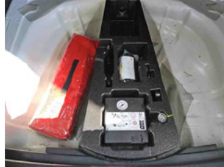
Equipment - Bordwerkzeug