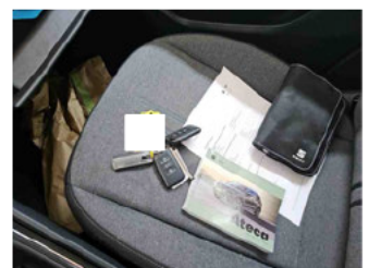
Equipment - Boardmappe/ Securitybag