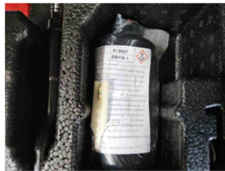
Räder - Haltbarkeitsdatum Tirefit