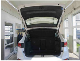
Innenraum - Kofferraum