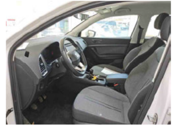
Innenraum - vorne