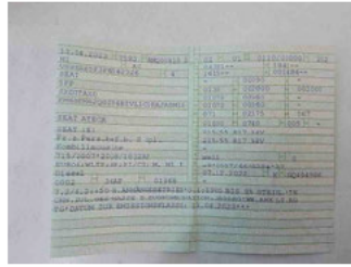
Fahrzeug - abgegebene ZB1