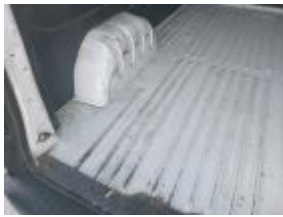
Puerta maletero Tras Iz