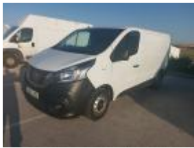
Montante de techo Dr