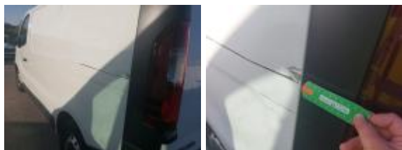
Caja Retrov Ext IZ Rayado Pintar