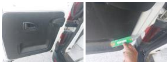
Panel Tras Iz Golpe(s) y arañazo(s) Reparar + Pintar