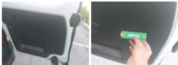
Guarnic Tapa Tras Rayado Reemplazar