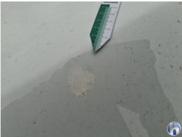
1. Motorhaube Verschmutzt - Entkleben / Reinigen