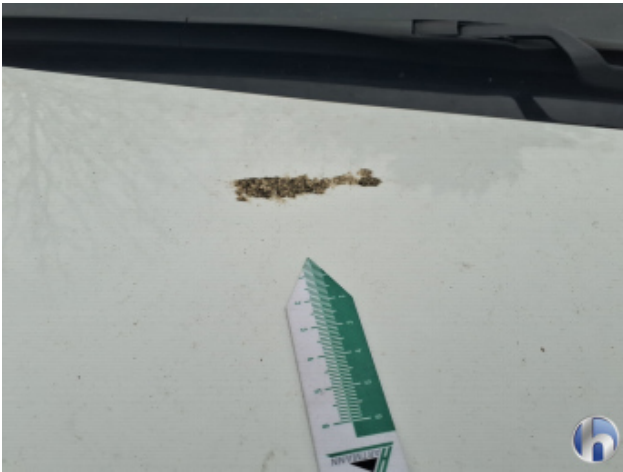
1. Motorhaube Verschmutzt - Entkleben / Reinigen