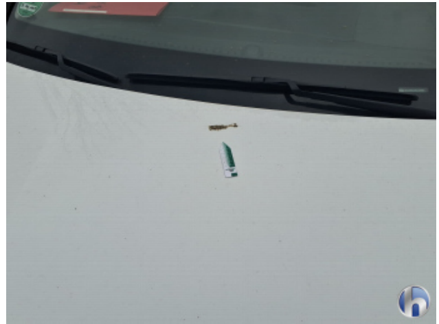
1. Motorhaube Verschmutzt - Entkleben / Reinigen