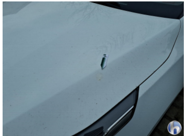
1. Motorhaube Verschmutzt - Entkleben / Reinigen