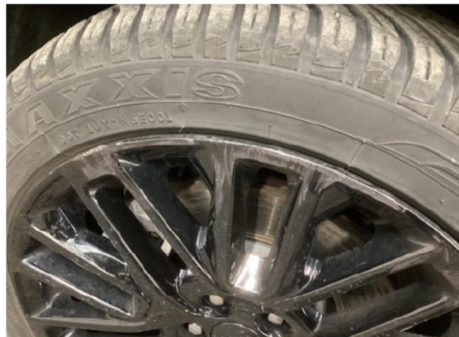
Felge (Ganzjahres-Radsatz) - Vorderachse links - ALU-Felge vo li verkratzt - SR