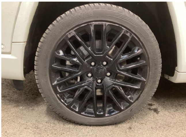
Felge (Ganzjahres-Radsatz) - Vorderachse links - ALU-Felge vo li verkratzt - SR