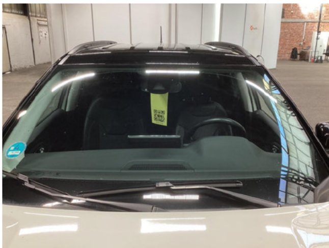
Windschutzscheibe - Steinschlag - kein Abzug