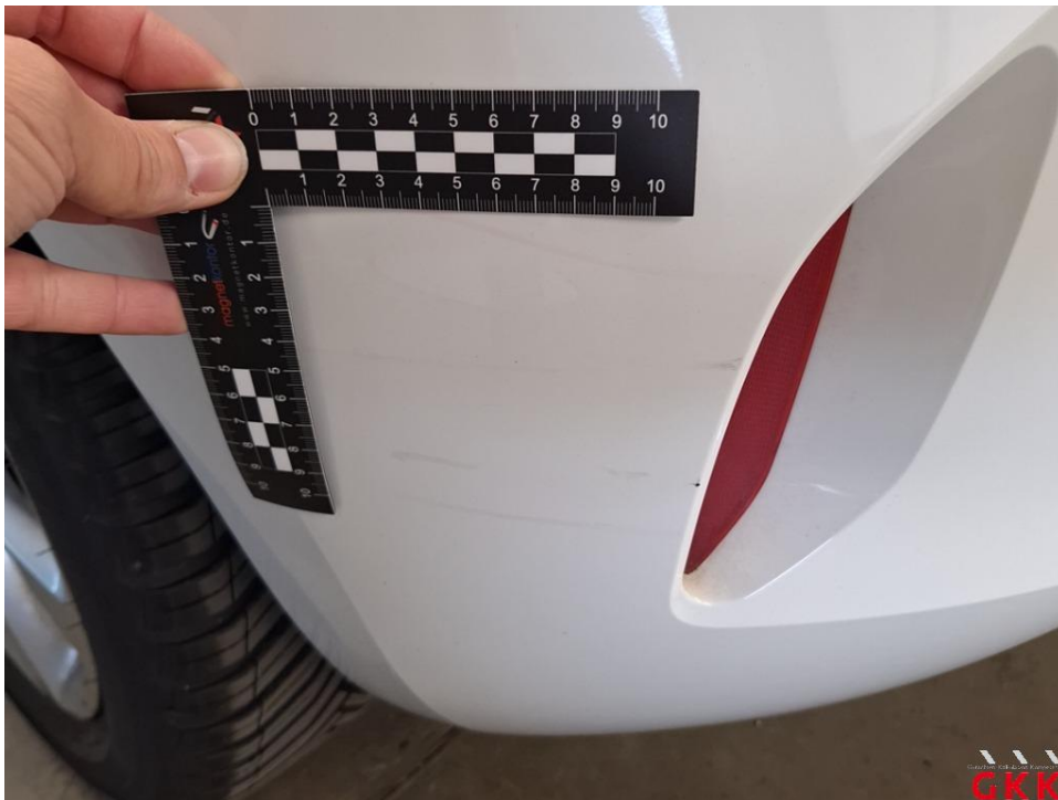
Bild 24 Stoßfänger hinten, Verkleidung -lackiert-, verkratzt, lackieren