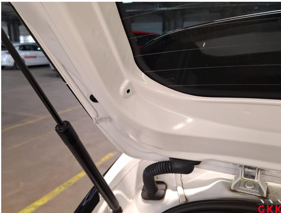
Bild 14 Laderaum, Abdeckung -Halteseil-, fehlt, ersetzen