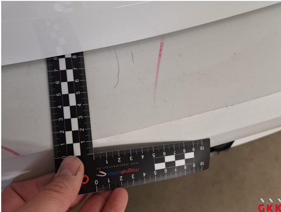
Bild 23 Stoßfänger hinten, Verkleidung -lackiert-, verkratzt, lackieren