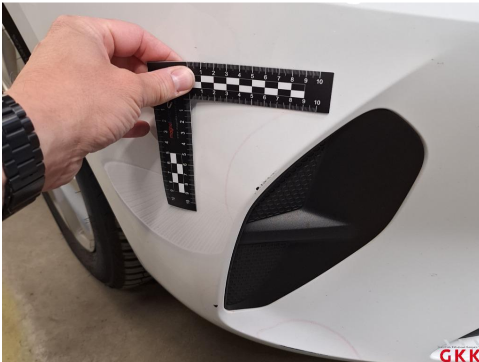
Bild 20 Stoßfänger vorne, Verkleidung -lackiert-, verkratzt, lackieren