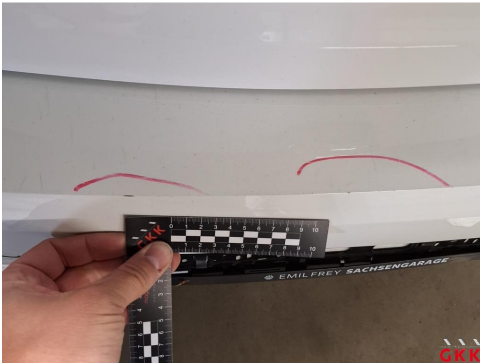
Bild 22 Stoßfänger hinten, Verkleidung -lackiert-, verkratzt, lackieren