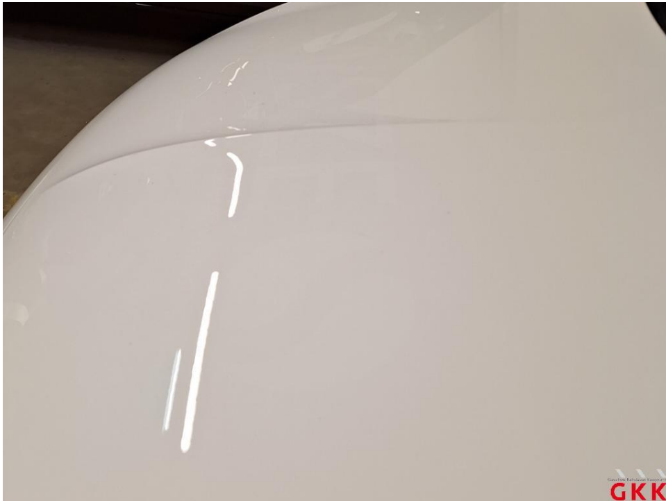
Bild 17 Fahrzeug, außen, Lackierung verwittert / matt, aufbereiten