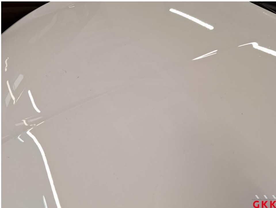
Bild 18 Fahrzeug, außen, Lackierung verwittert / matt, aufbereiten