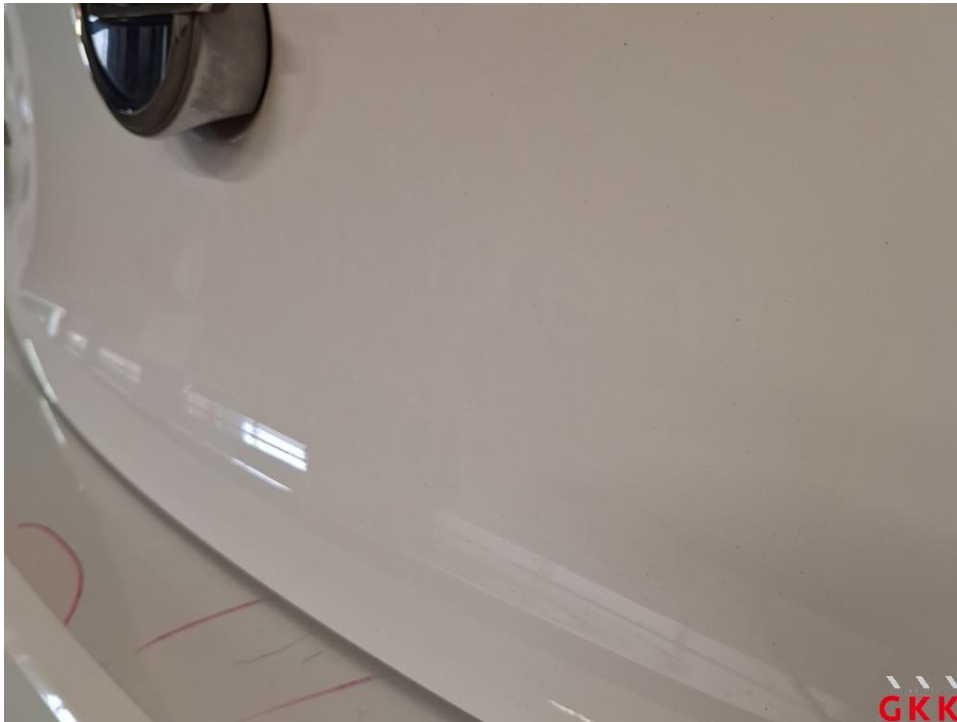
Bild 19 Fahrzeug, außen, Lackierung verwittert / matt, aufbereiten