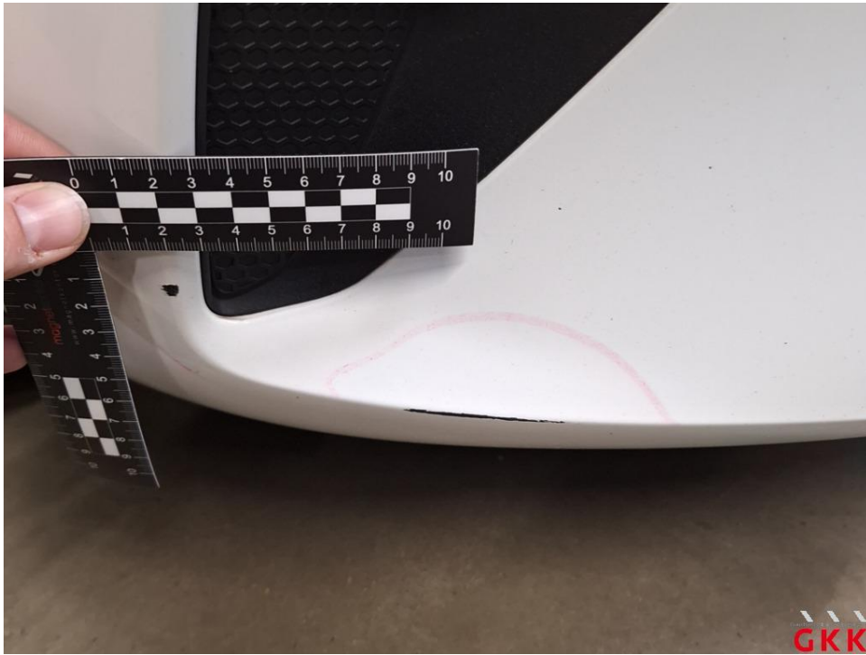
Bild 21 Stoßfänger vorne, Verkleidung -lackiert-, verkratzt, lackieren