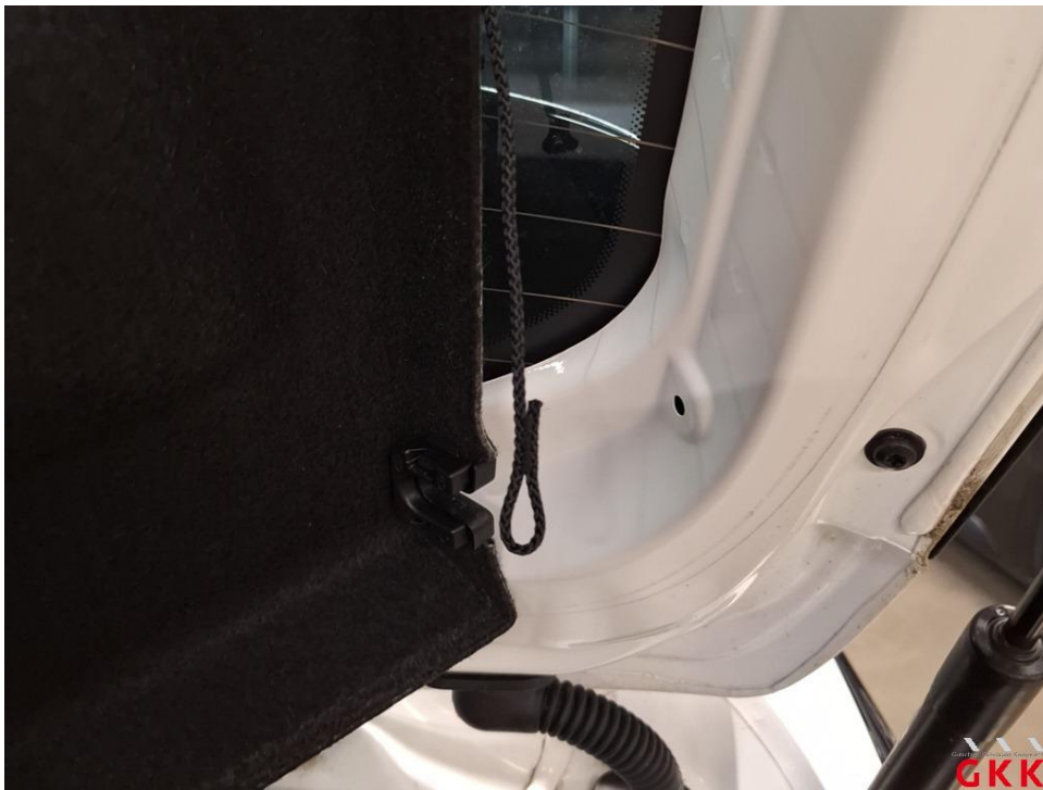
Bild 16 Laderaum, Abdeckung -Halteseil-, fehlt, ersetzen