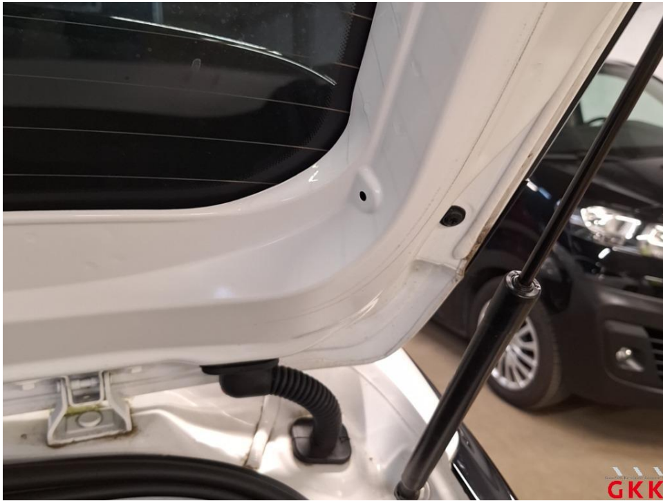
Bild 15 Laderaum, Abdeckung -Halteseil-, fehlt, ersetzen