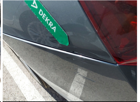
Aleta / Trasero Izquierdo / Abolladura