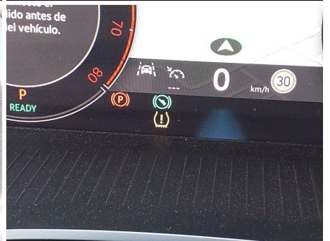
Indicador de presión de neumáticos / Defectuoso