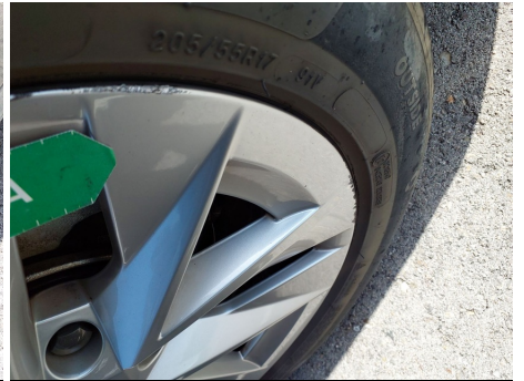
Llanta / Delantero Derecho / Rayado