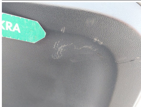
guarnecido de porton / Trasero / Rayado