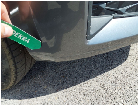
Paragolpes / Delantero / Ralladura