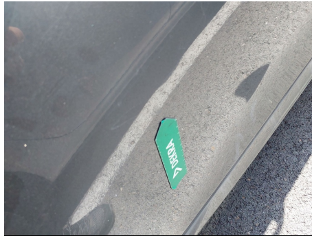
Puerta / Trasero Derecho / Abolladura