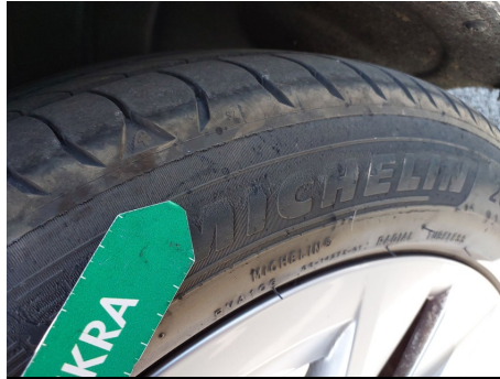
Neumático / Trasero Izquierdo / Desgastado