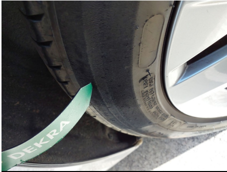
Neumático / Trasero Izquierdo / Desgastado