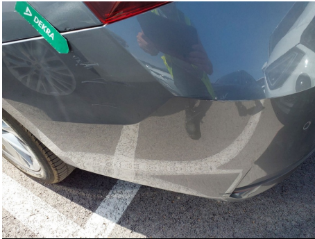
Paragolpes / Trasero / Ralladura