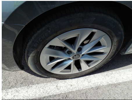
Llanta / Delantero Izquierdo / Rayado