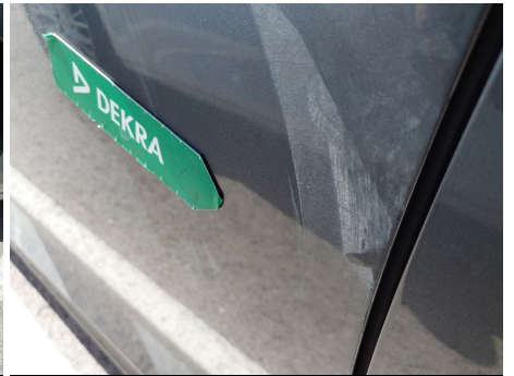
Puerta / Delantero Izquierdo / Abolladura