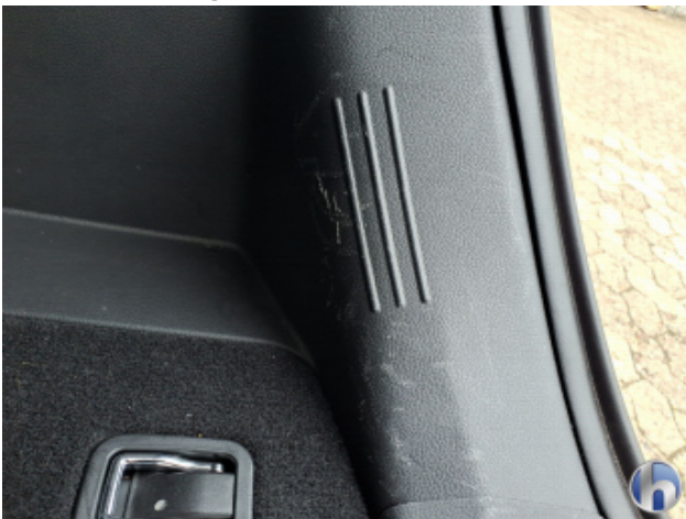
7. Verkleidung Verschmutzt - Reinigen