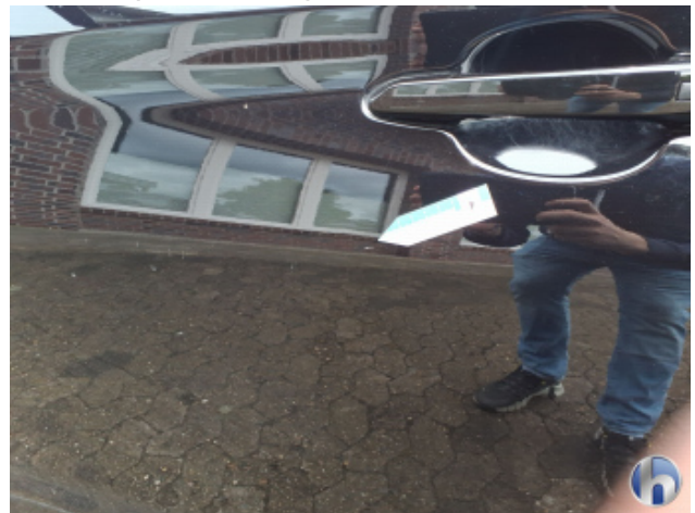
5. Tür Vorne - Links Kratzer - Smart Repair