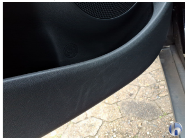
7. Verkleidung Verschmutzt - Reinigen