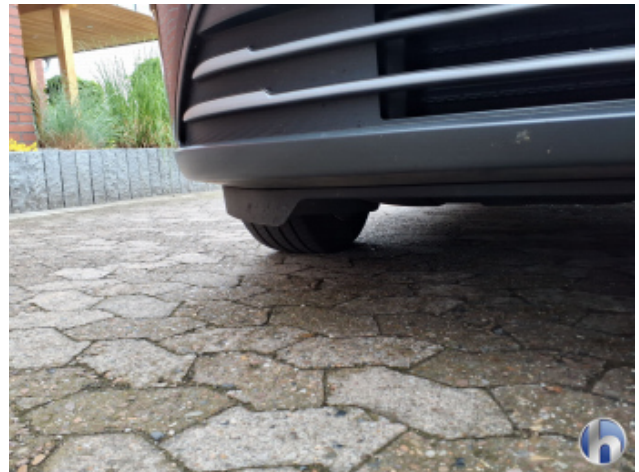
3. Stoßfänger Vorne Gebrauchsspuren - Ohne Reparatur