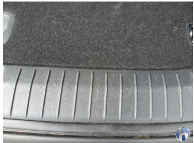
7. Verkleidung Verschmutzt - Reinigen