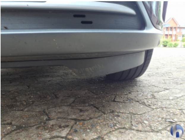
3. Stoßfänger Vorne Gebrauchsspuren - Ohne Reparatur