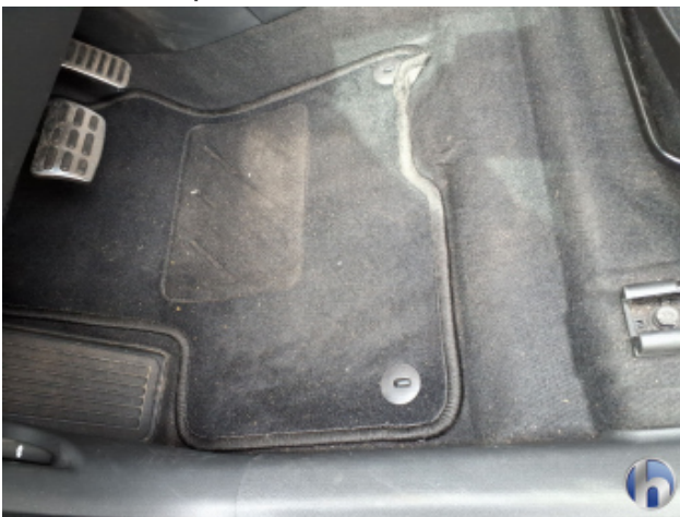
7. Verkleidung Verschmutzt - Reinigen