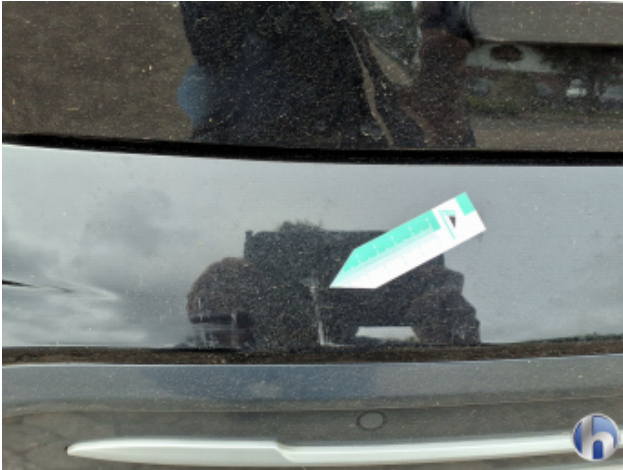
1. Stoßfänger Hinten Kratzer - Smart Repair