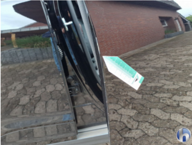
6. Tür Vorne - Rechts Kratzer - Smart Repair