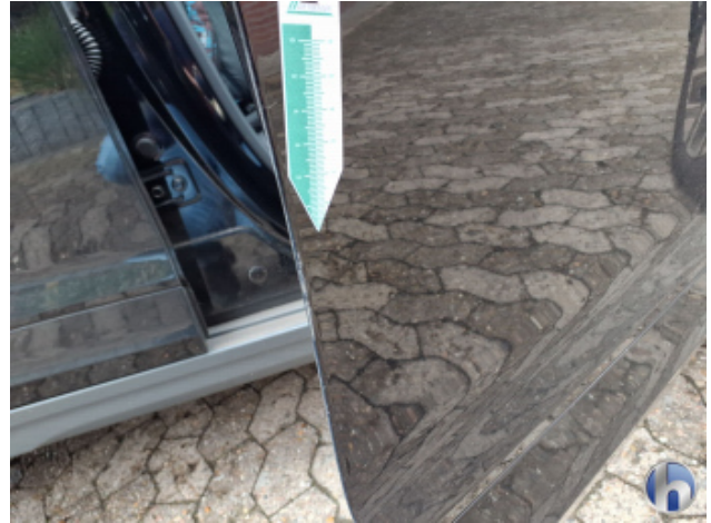
6. Tür Vorne - Rechts Kratzer - Smart Repair