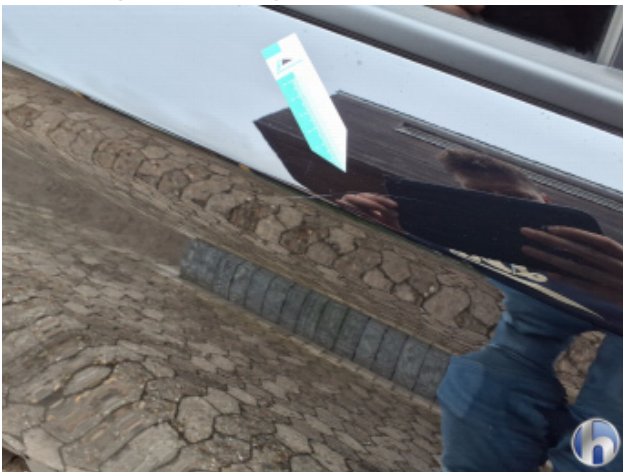
4. Tür Hinten - Rechts Kratzer - Smart Repair