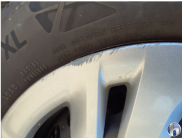
3. Radkappe - Vorne - Links Beschädigt - Erneuern