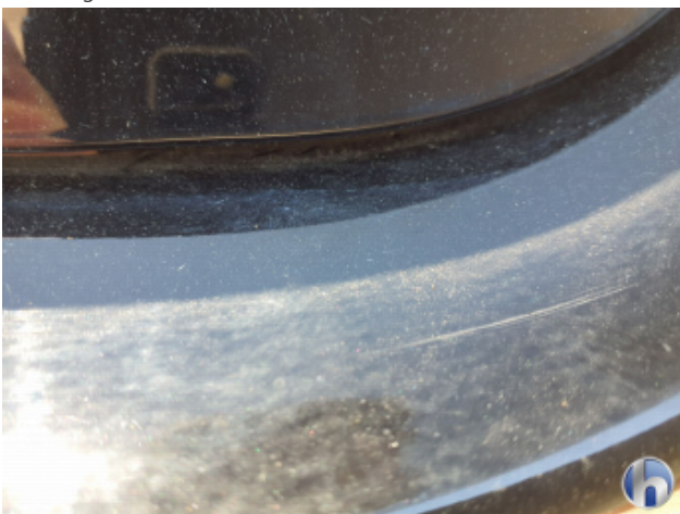
1. Stoßfänger Hinten Kratzer - Lackieren