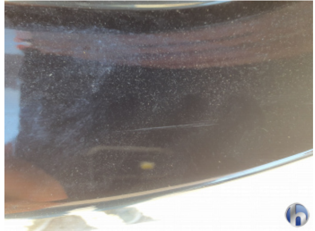
1. Stoßfänger Hinten Kratzer - Lackieren