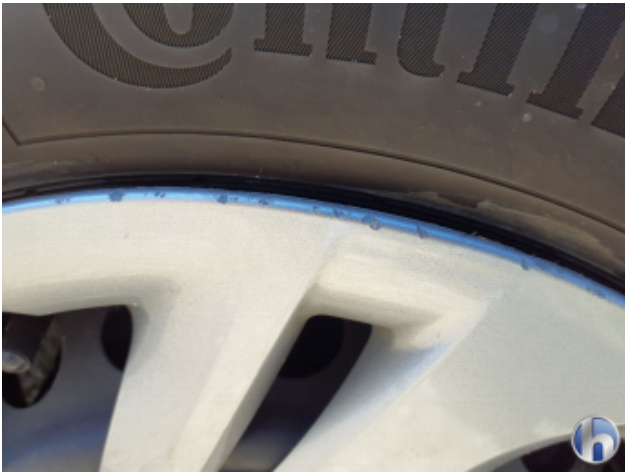
3. Radkappe - Vorne - Links Beschädigt - Erneuern