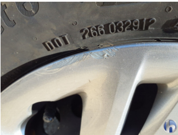
2. Radkappe - Hinten - Links Beschädigt - Erneuern