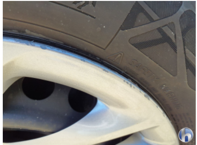
3. Radkappe - Vorne - Links Beschädigt - Erneuern