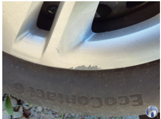
3. Radkappe - Vorne - Links Beschädigt - Erneuern