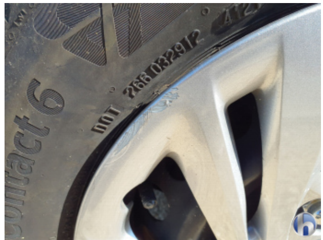
2. Radkappe - Hinten - Links Beschädigt - Erneuern