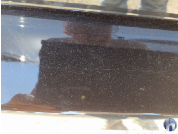
1. Stoßfänger Hinten Kratzer - Lackieren