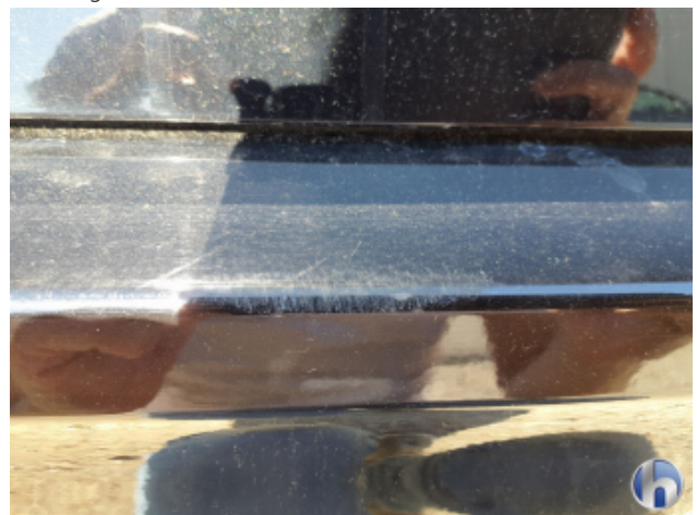
1. Stoßfänger Hinten Kratzer - Lackieren