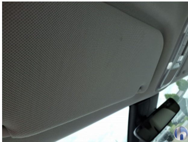
1. Innenraum Verschmutzt - Reinigen