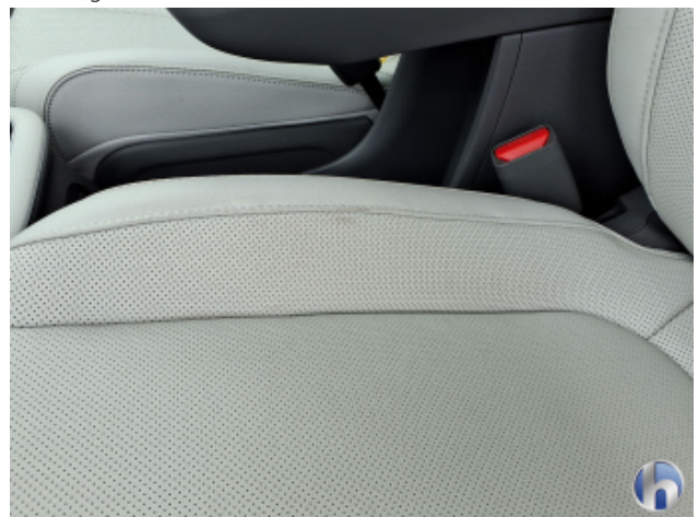
1. Innenraum Verschmutzt - Reinigen