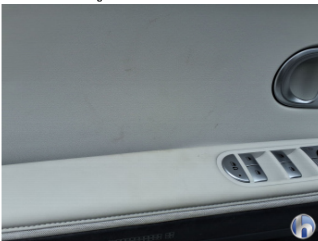
1. Innenraum Verschmutzt - Reinigen