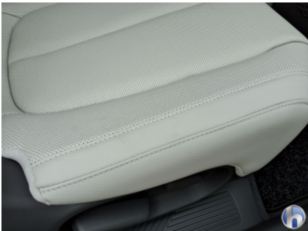
1. Innenraum Verschmutzt - Reinigen