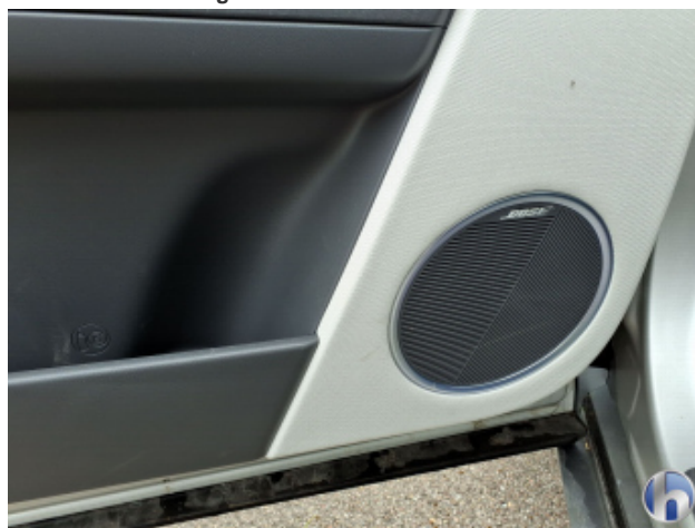
1. Innenraum Verschmutzt - Reinigen