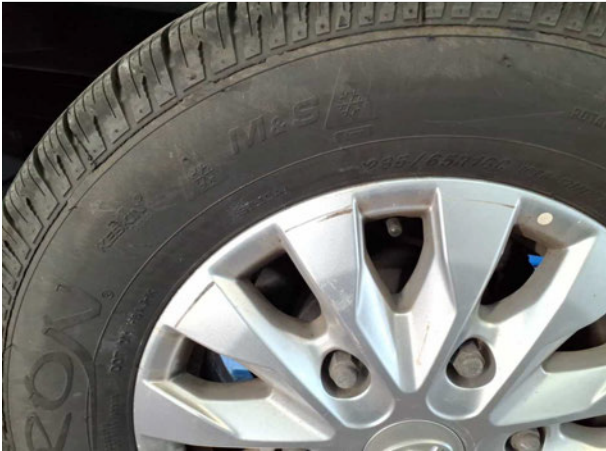
Beschädigung #2: Rad/Reifen: Leichtmetallfelge hinten rechts - Kratzer - Smart Repair