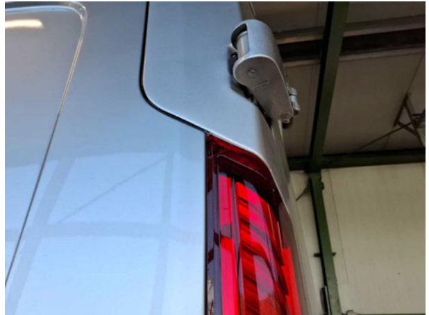
Beschädigung #4: Heckleuchte: Heckleuchte links - gebrochen / gerissen - erneuern