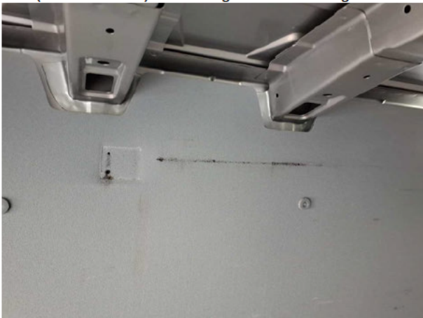
Beschädigung #1: Verkleidungen/Abdeckungen: Laderaumverkleidung links (vorn und hinten) - beschädigt - Wertminderung