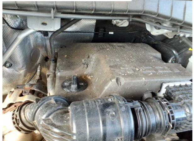
Beschädigung #3: Motor: Motorabdeckung - Marderschaden - erneuern