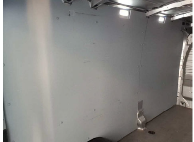
Beschädigung #1: Verkleidungen/Abdeckungen: Laderaumverkleidung links (vorn und hinten) - beschädigt -