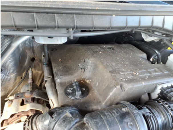
Beschädigung #3: Motor: Motorabdeckung - Marderschaden - erneuern