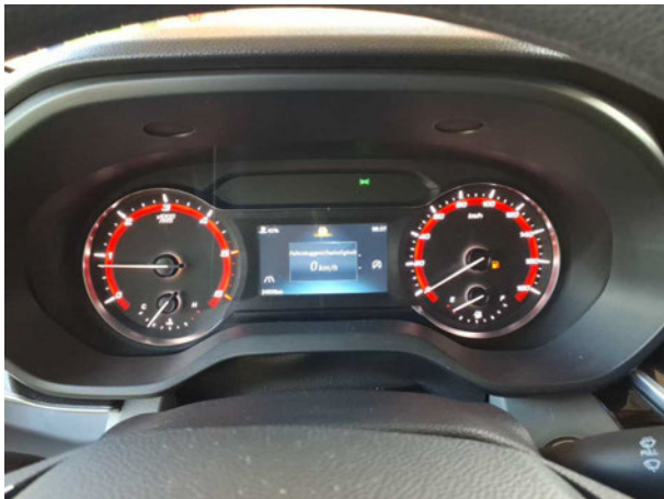
Abbildung 9: Kombiinstrument