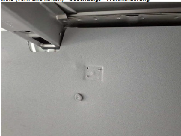
Beschädigung #1: Verkleidungen/Abdeckungen: Laderaumverkleidung links (vorn und hinten) - beschädigt - Wertminderung