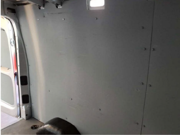
Beschädigung #1: Verkleidungen/Abdeckungen: Laderaumverkleidung links (vorn und hinten) - beschädigt - Wertminderung