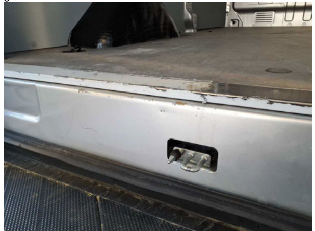
Beschädigung #5: Karosserie: Karosserie (Abschlussblech) - Delle / Lackschaden - instandsetzen und lackieren