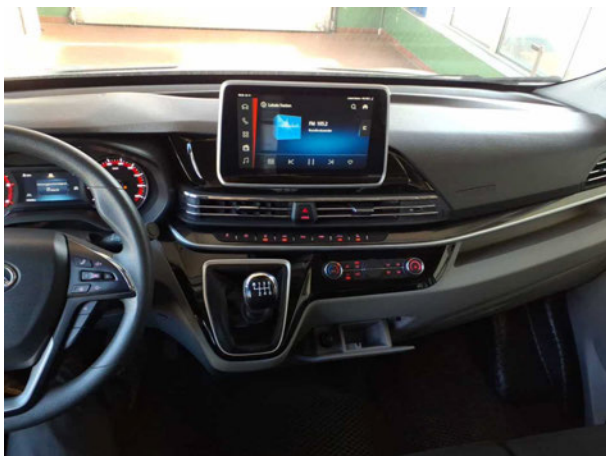
Abbildung 11: Instrumententafel