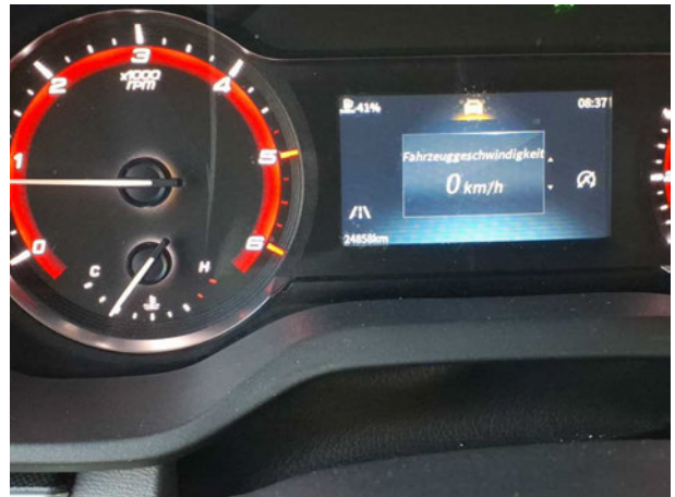
Abbildung 10: Laufleistung