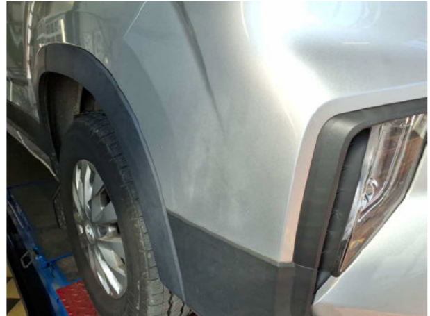
Beschädigung #6: Stossfänger vorn: Stossfänger vorn - Lackmangel - lackieren