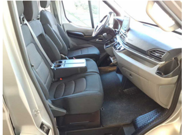
Abbildung 8: Innenraum vorne