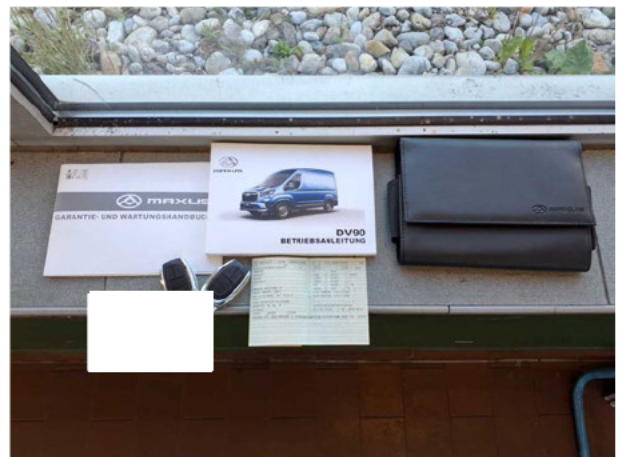
Abbildung 16: Sonstiges