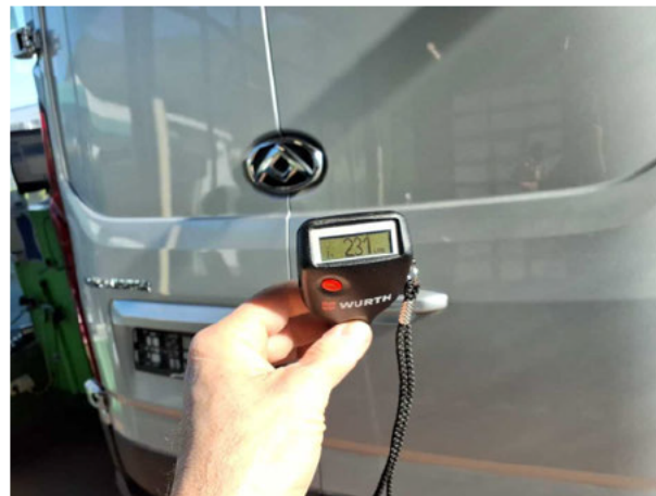
Nacklackierung 1: Dach, Heckklappe/-tür, Seitenwand links