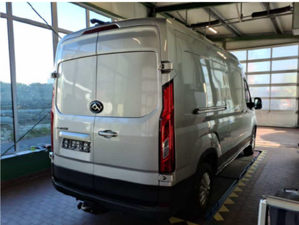
Abbildung 3: Schräg hinten