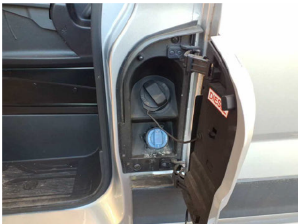
Abbildung 15: Ladebuchse/Tankstutzen