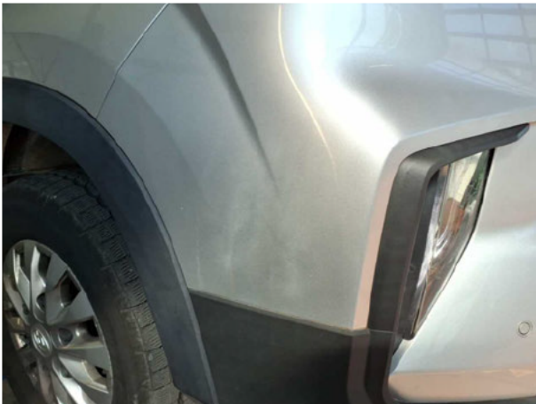
Beschädigung #6: Stossfänger vorn: Stossfänger vorn - Lackmangel - lackieren