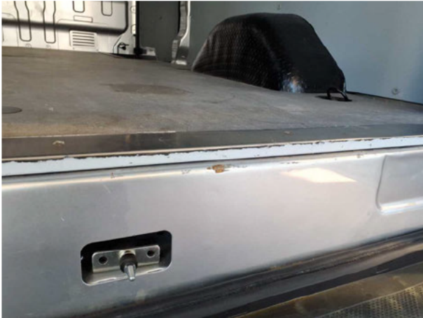
Beschädigung #5: Karosserie: Karosserie (Abschlussblech) - Delle / Lackschaden - instandsetzen und lackieren