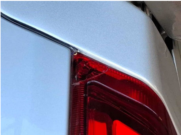
Beschädigung #4: Heckleuchte: Heckleuchte links - gebrochen / gerissen - erneuern