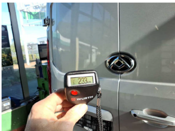
Nacklackierung 1: Dach, Heckklappe/-tür, Seitenwand links