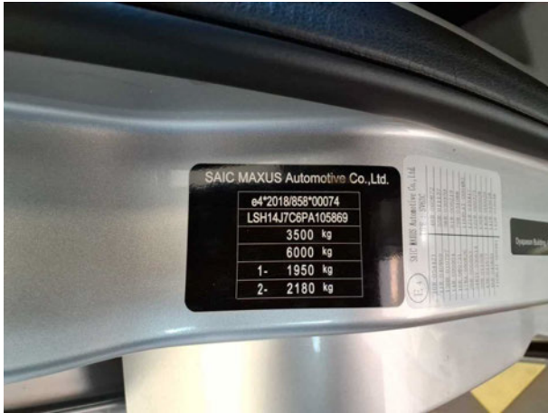
Abbildung 7: FIN