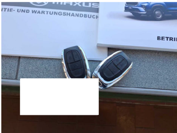
Abbildung 17: Sonstiges