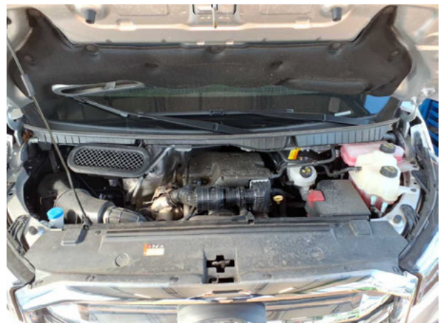
Abbildung 6: Motorraum