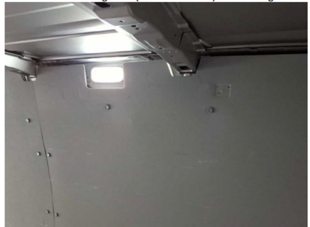
Beschädigung #1: Verkleidungen/Abdeckungen: Laderaumverkleidung links (vorn und hinten) - beschädigt -