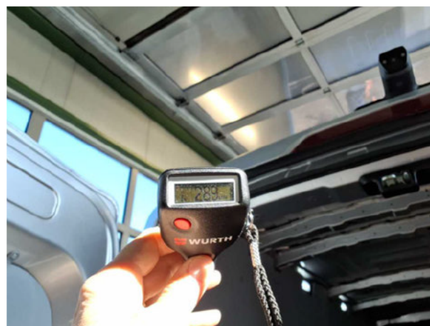
Nacklackierung 1: Dach, Heckklappe/-tür, Seitenwand links