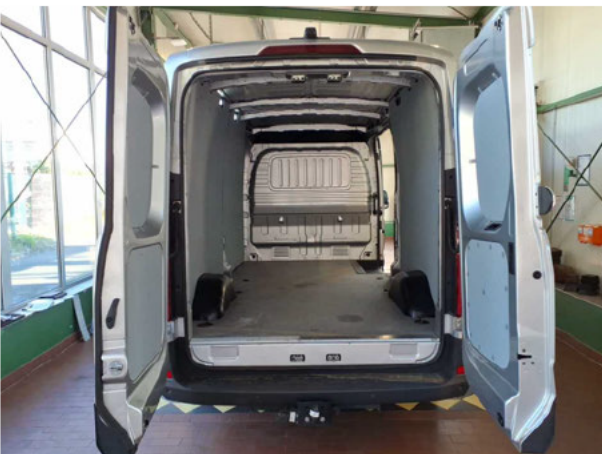
Abbildung 5: Laderraum