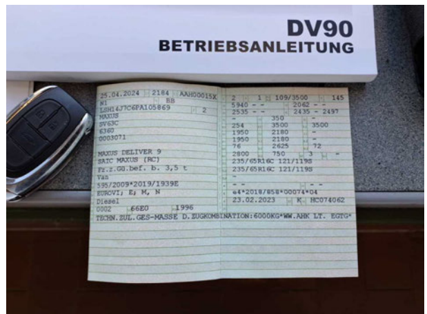
Abbildung 12: Zulassungsdokument(e)