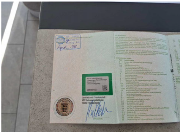
Abbildung 13: Zulassungsdokument(e)