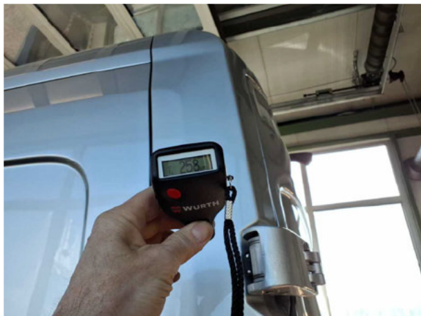
Nacklackierung 1: Dach, Heckklappe/-tür, Seitenwand links