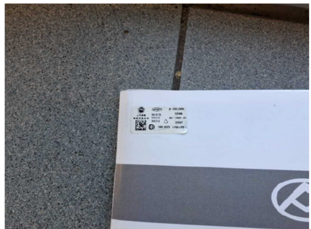
Abbildung 18: Sonstiges