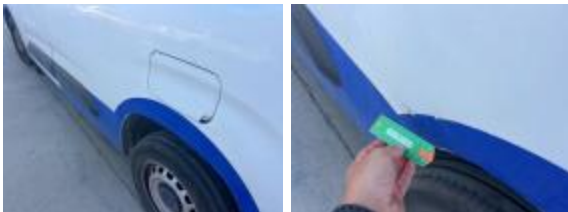
Puerta Delant Iz Rayado Pintar