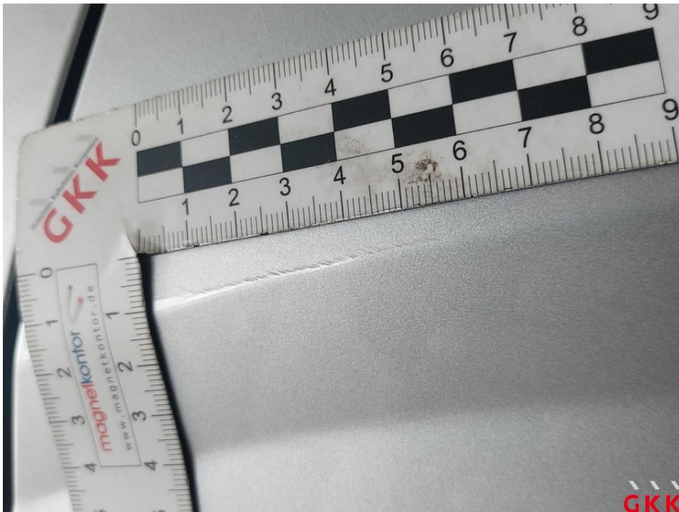
Bild 16. Seitenwand links, verkratzt, lackieren