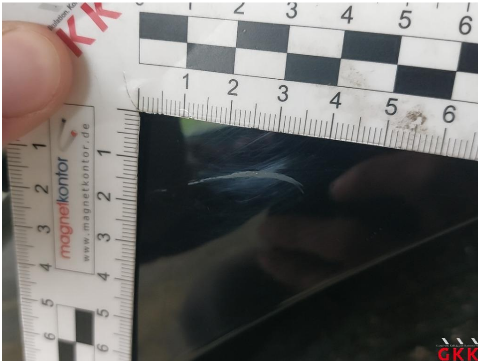
Bild 18. Tür hinten links, Leiste, Radlauf, verkratzt, ersetzen