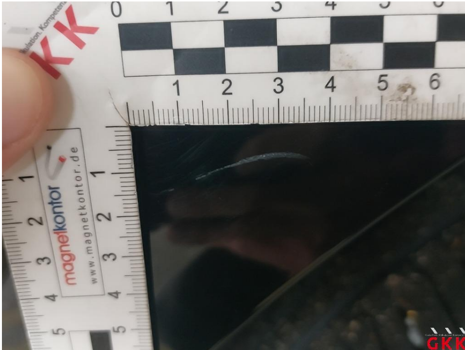
Bild 19. Tür hinten links, Leiste, Radlauf, verkratzt, ersetzen