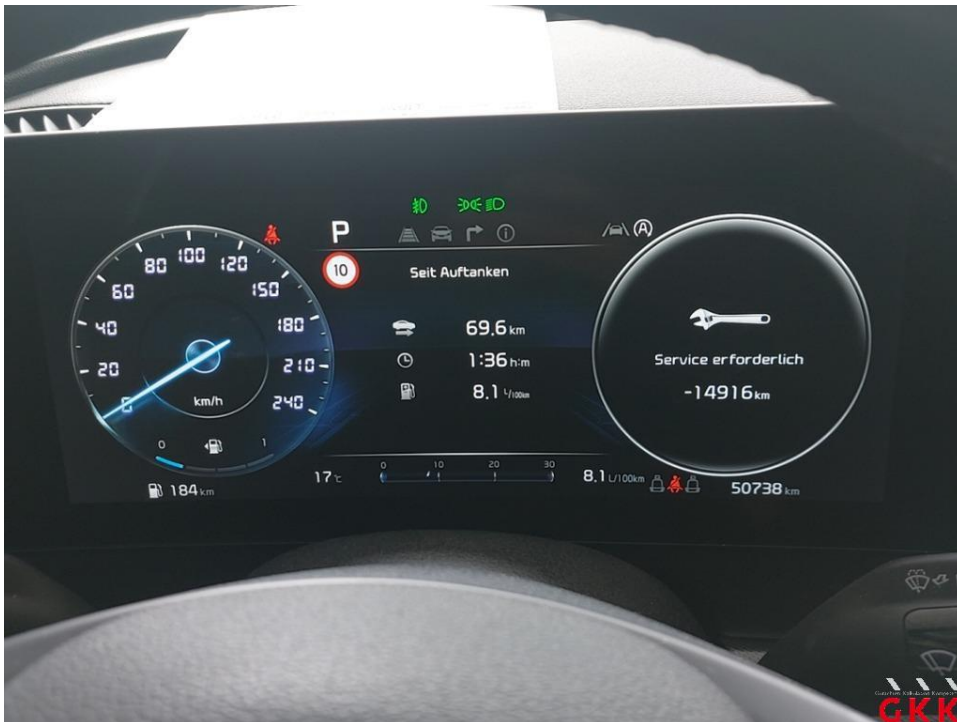
Bild 20. Inspektion groß, Mittelklasse, fällig, durchführen