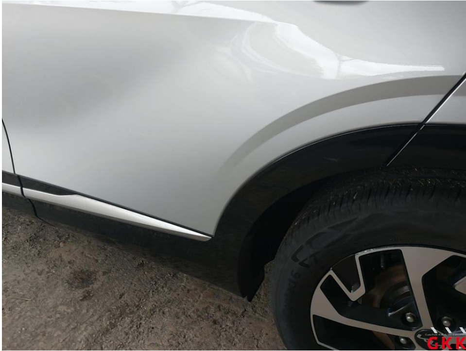
Bild 17. Tür hinten links, Leiste, Radlauf, verkratzt, ersetzen