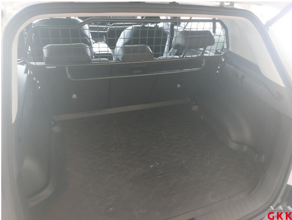
Bild 13. Laderaum, Abdeckung, fehlt, ersetzen