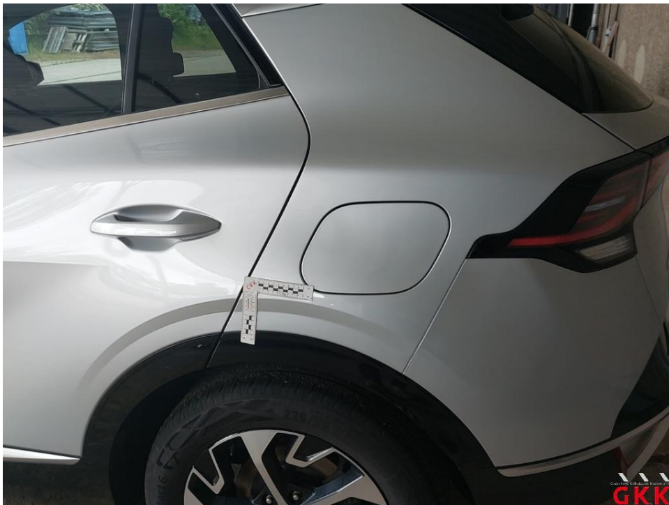
Bild 14. Seitenwand links, verkratzt, lackieren