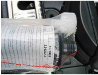
Räder - Haltbarkeitsdatum Tirefit