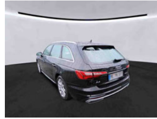
Fahrzeugansicht - diagonal hinten links