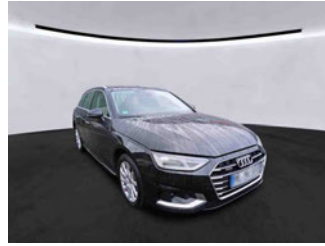
Fahrzeugansicht - diagonal vorne rechts