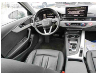
Innenraum - Mittelkonsole