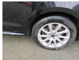
Räder - Rad montiert hinten links