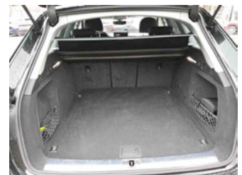
Innenraum - Kofferraum