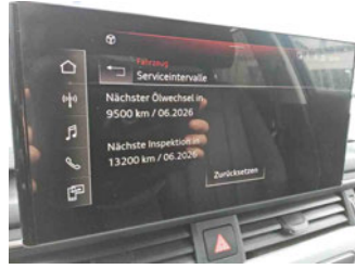
Fahrzeug - Serviceunterlagen / Wartungsnachweis