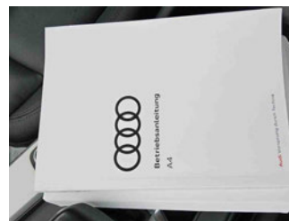
Equipment - Boardmappe/ Securitybag