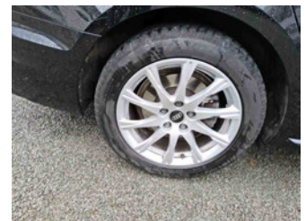
Räder - Rad montiert hinten rechts