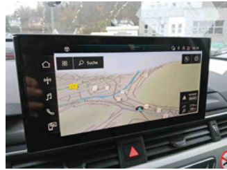
Innenraum - Navigationsgerät/Radio