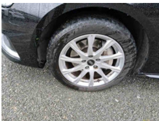
Räder - Rad montiert vorne links