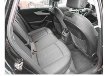
Innenraum - hinten