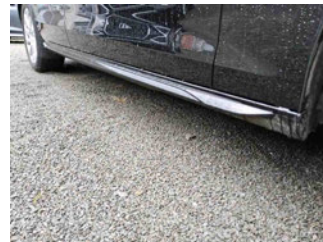
Seitenansicht - Schweller rechts