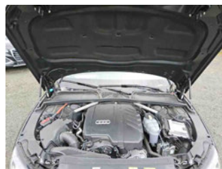
Fahrzeug - Motorraum offen