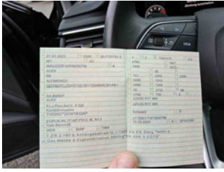
Fahrzeug - abgegebene ZB1