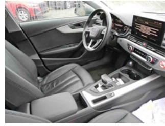
Innenraum - vorne