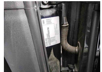
Fahrzeug - Typenschild/Fahrgestellnummer