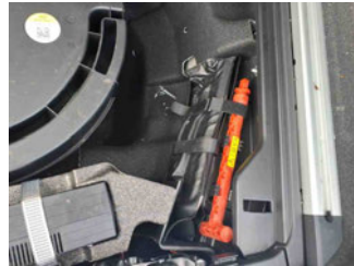
Equipment - Bordwerkzeug