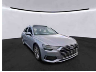
Fahrzeugansicht - diagonal vorne rechts