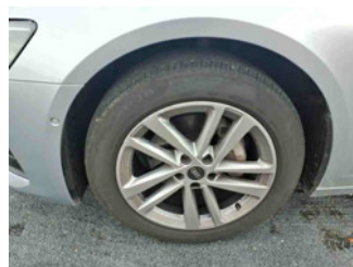
Räder - Rad montiert vorne links