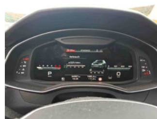
Innenraum - Cockpit mit Laufleistung