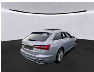
Fahrzeugansicht - diagonal hinten rechts