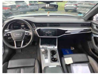
Innenraum - Mittelkonsole