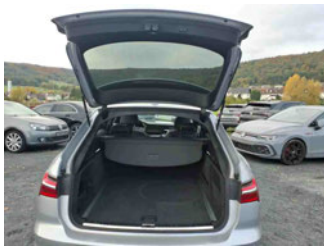
Innenraum - Kofferraum