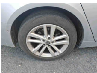
Räder - Rad montiert hinten rechts