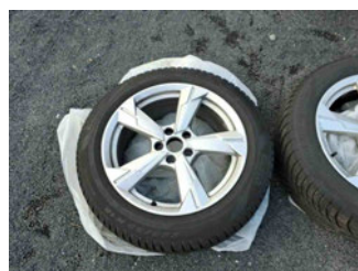
Räder - Rad beiliegend #1