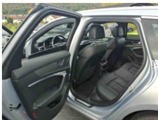
Innenraum - hinten