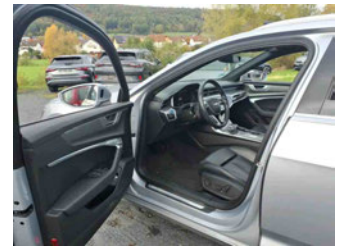
Innenraum - vorne