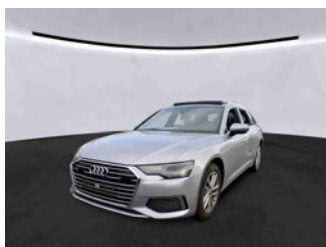
Fahrzeugansicht - diagonal vorne links

Auftrags-Nr: 1002134968 Besichtigt am: 16.10.2025 10:55 Berichts-Nr: 9237696 FIN: WAUZZZF21NN056482