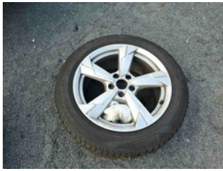
Räder - Rad beiliegend #4