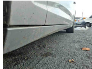
Seitenansicht - Schweller links