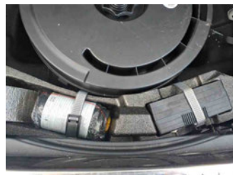
Räder - Haltbarkeitsdatum Tirefit