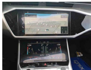
Innenraum - Navigationsgerät/Radio