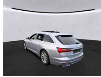
Fahrzeugansicht - diagonal hinten links