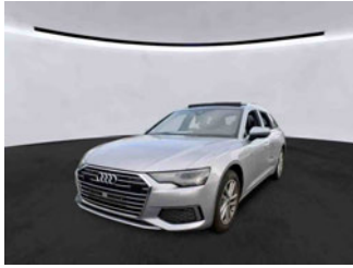
Fahrzeugansicht - diagonal vorne links