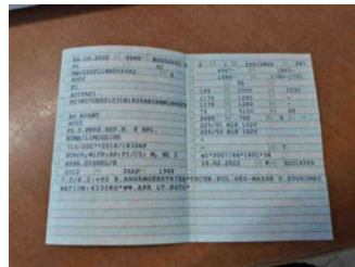
Fahrzeug - abgegebene ZB1