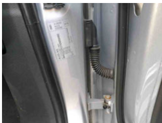
Fahrzeug - Typenschild/Fahrgestellnummer