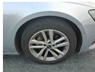
Räder - Rad montiert vorne rechts