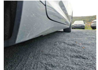
Seitenansicht - Schweller rechts