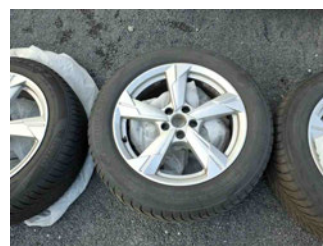
Räder - Rad beiliegend #2