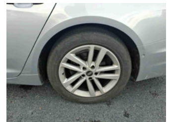
Räder - Rad montiert hinten links