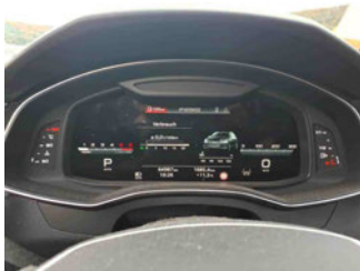
Innenraum - Cockpit mit Laufleistung