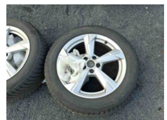
Räder - Rad beiliegend #3