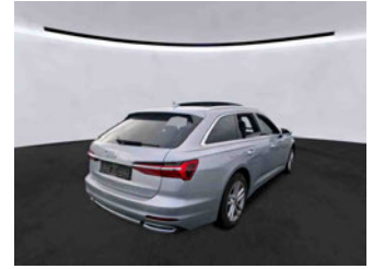
Fahrzeugansicht - diagonal hinten rechts