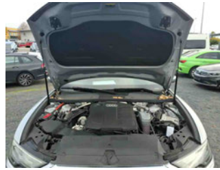
Fahrzeug - Motorraum offen