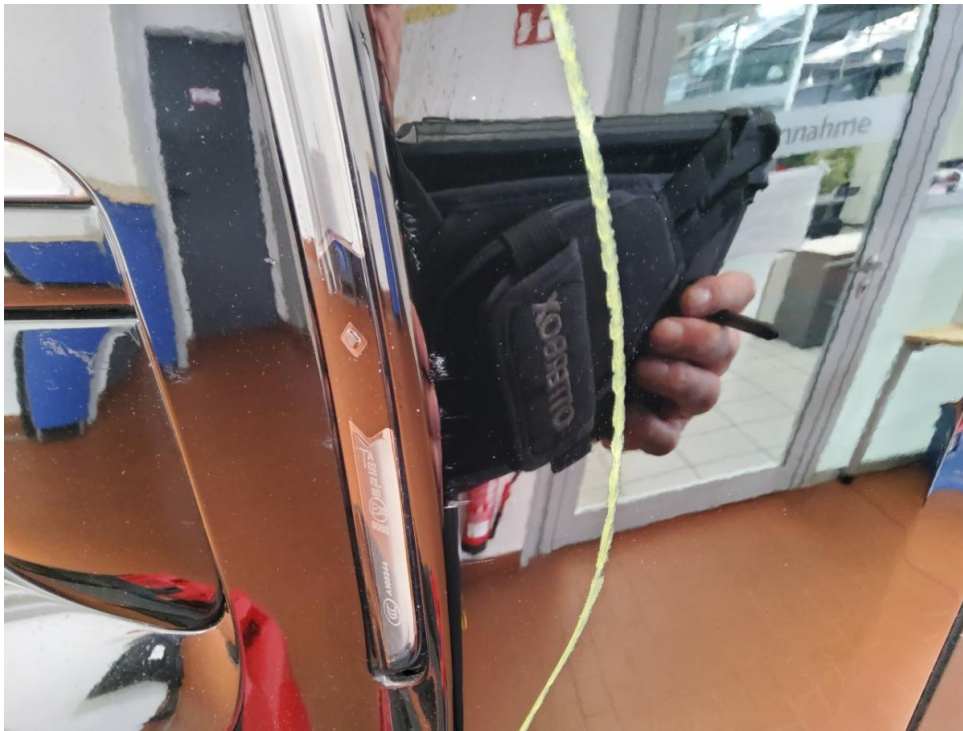
Stoßfänger vorne - SmartRepair