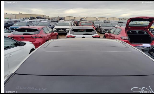
FESD_WHATSAPP IMAGE 2025-10-31 AT 15.01.37 (1).JPEG