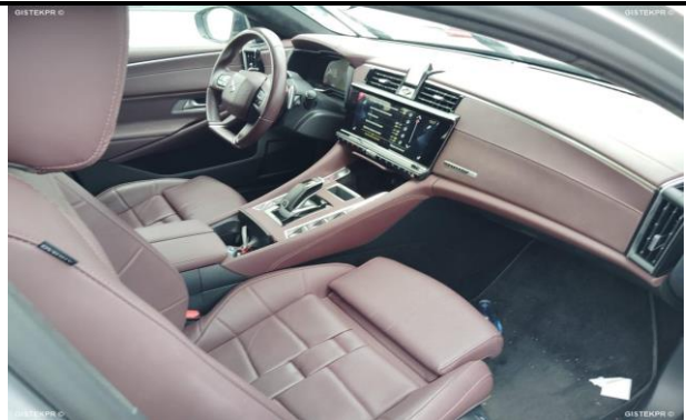
FVOL_WHATSAPP IMAGE 2025-10-31 AT 15.01.37 (5).JPEG