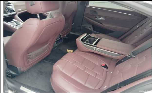
FASTRAS_WHATSAPP IMAGE 2025-10-31 AT 15.01.36 (12).JPEG