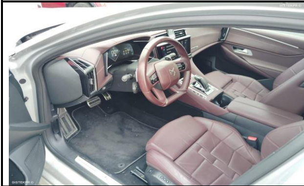
FASDEL_WHATSAPP IMAGE 2025-10-31 AT 15.01.36 (11).JPEG