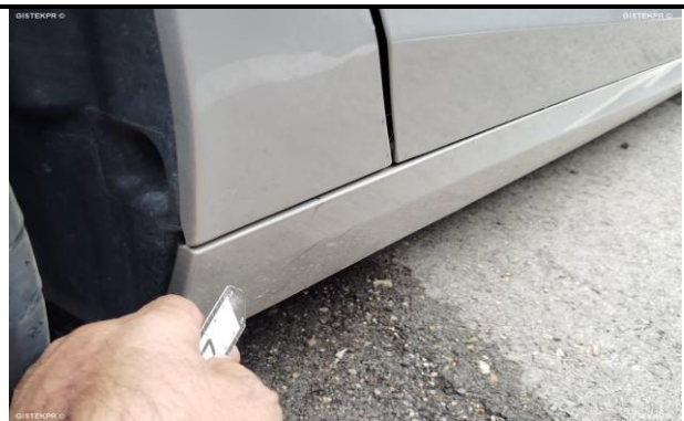
Foto daños externos 1