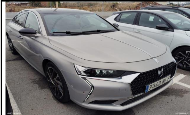
FFLTD_WHATSAPP IMAGE 2025-10-31 AT 15.01.38 (1).JPEG