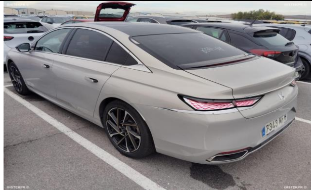
FTLTI_WHATSAPP IMAGE 2025-10-31 AT 15.01.38 (4).JPEG