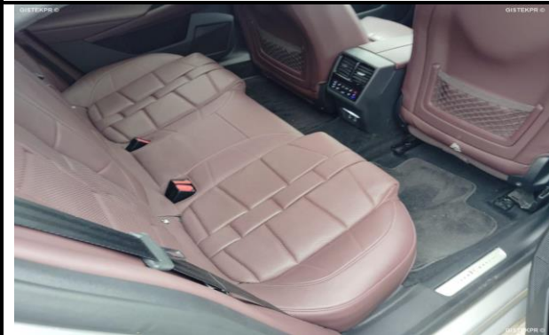
FCOKCOMB_WHATSAPP IMAGE 2025-10-31 AT 15.01.37 (3).JPEG

INFORME-STELL-RE-BUY- P-2-2025__(VR1X25GGRN2801934- 7343MFV).DOC