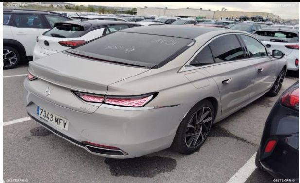
FLTD_WHATSAPP IMAGE 2025-10-31 AT 15.01.38 (2).JPEG