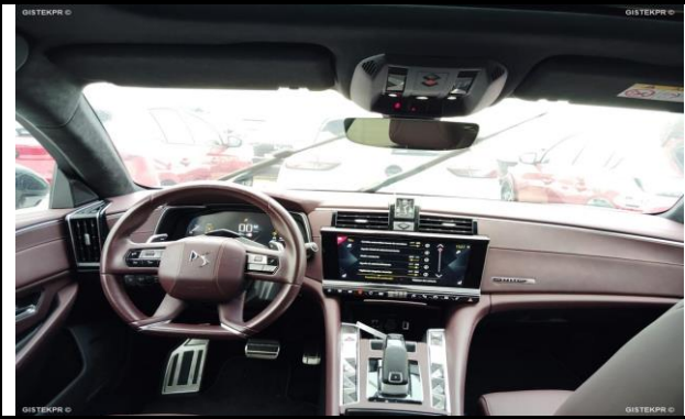
FSALP_WHATSAPP IMAGE 2025-10-31 AT 15.01.37 (2).JPEG