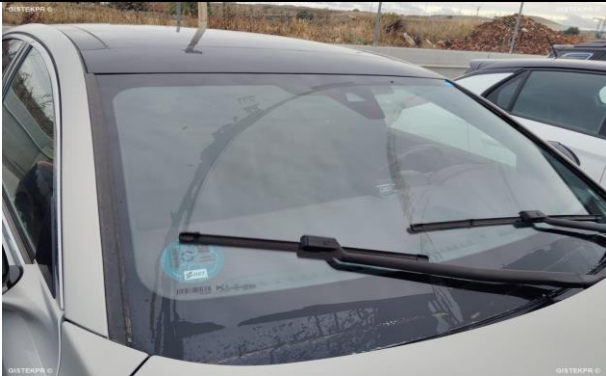
FESD_WHATSAPP IMAGE 2025-10-31 AT 15.01.38.JPEG