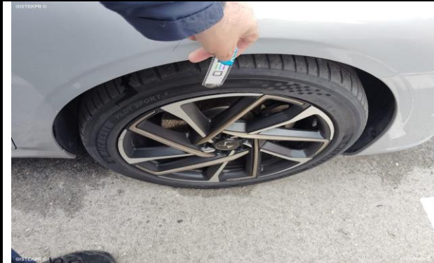
FLLAN_WHATSAPP IMAGE 2025-10-31 AT 15.01.37 (7).JPEG