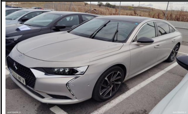
FFLTI_WHATSAPP IMAGE 2025-10-31 AT 15.01.38 (5).JPEG

INFORME-STELL-RE-BUY- P-2-2025__(VR1X25GGRN2801934- 7343MFV).DOC