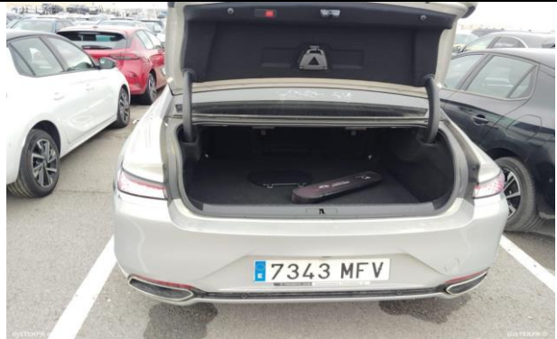
FMLTRO_WHATSAPP IMAGE 2025-10-31 AT 15.01.37.JPEG