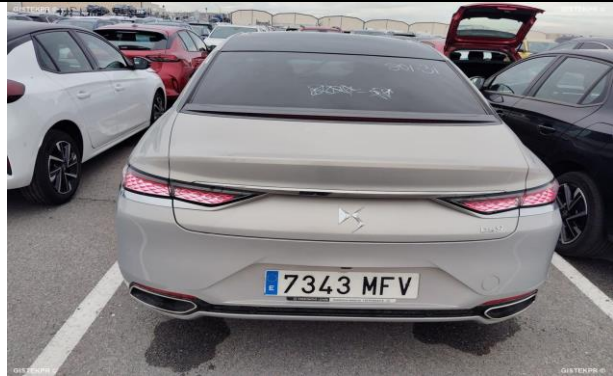
FTRAS_WHATSAPP IMAGE 2025-10-31 AT 15.01.38 (3).JPEG