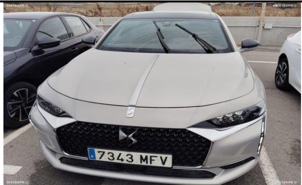
FDEL_WHATSAPP IMAGE 2025-10-31 AT 15.01.38 (6).JPEG