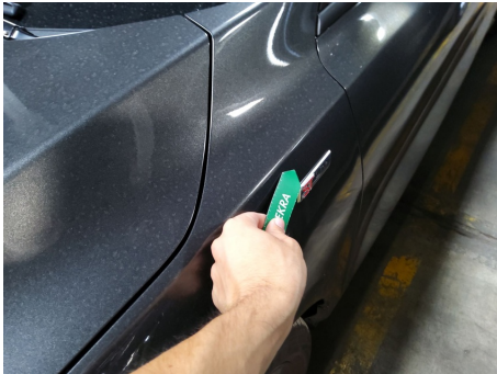
Aleta / Delantero izquierdo / Abolladura