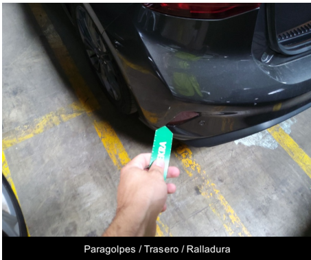
Paragolpes / Trasero / Ralladura