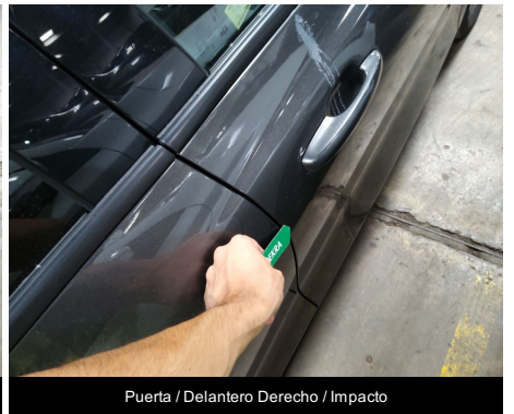
Puerta / Delantero Derecho / Impacto