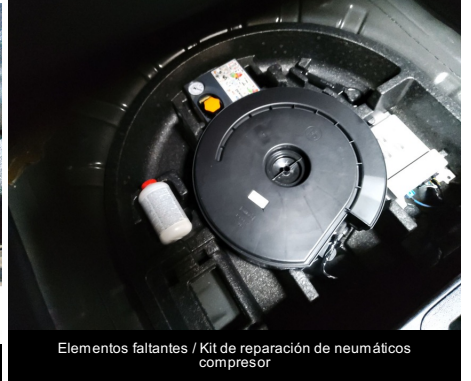
Elementos faltantes / Kit de reparación de neumáticos compresor