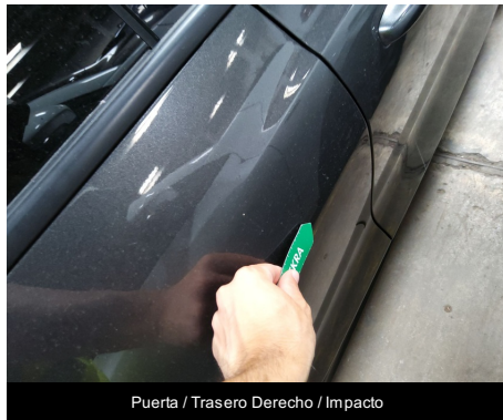
Puerta / Trasero Derecho / Impacto