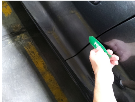
Puerta / Delantero izquierdo / Abolladura