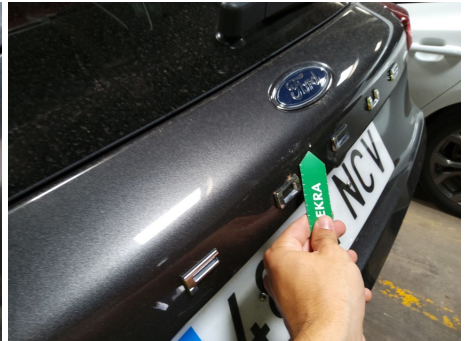
Portón trasero / puerta del maletero / - / Impacto