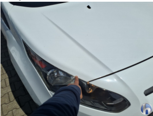
1. Motorhaube Steinschlag - Lackieren