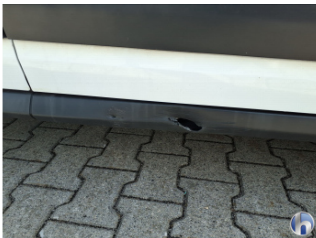
2. Schweller - Rechts Unfallschaden - Erneuern