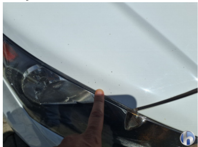
1. Motorhaube Steinschlag - Lackieren