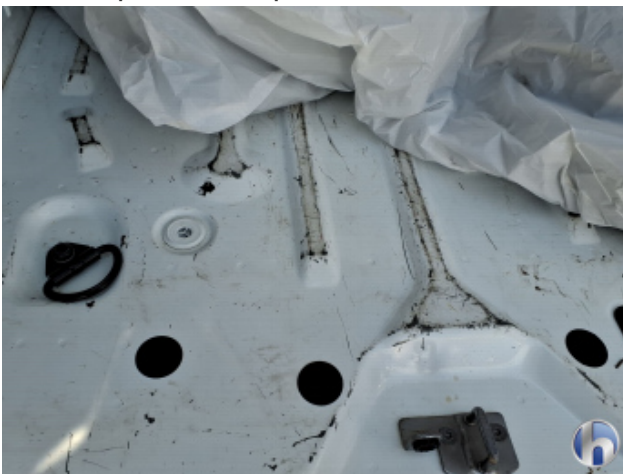
7. Laderaumboden Kratzer - Smart Repair