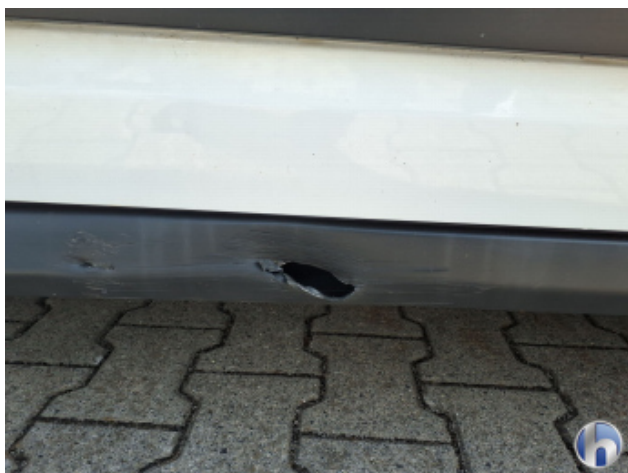
2. Schweller - Rechts Unfallschaden - Erneuern