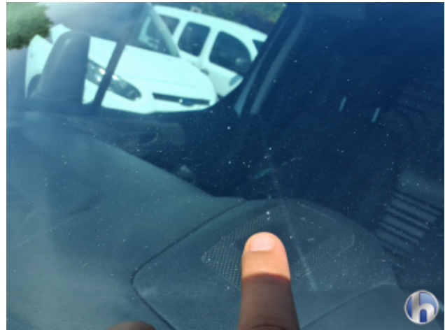
5. Windschutzscheibe Gebrauchsspuren - Ohne Reparatur