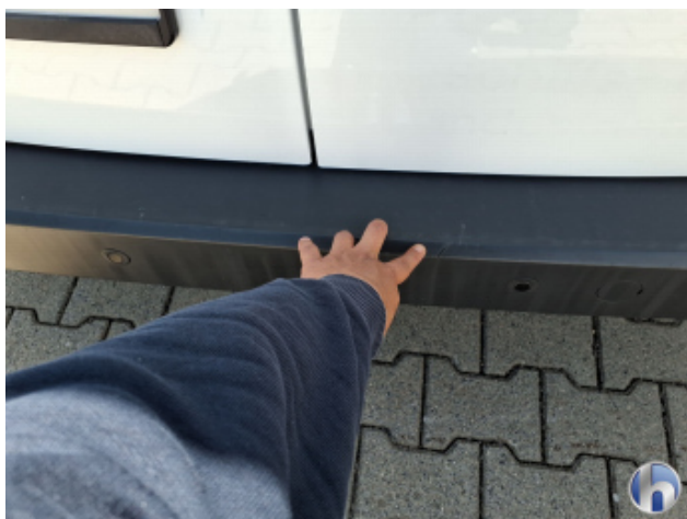
3. Stoßfänger Hinten Riss - Erneuern