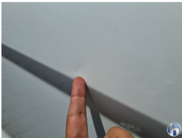
4. Tür Hinten - Links Verdellt - Sanft Instandsetzen