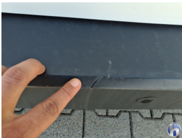
3. Stoßfänger Hinten Riss - Erneuern