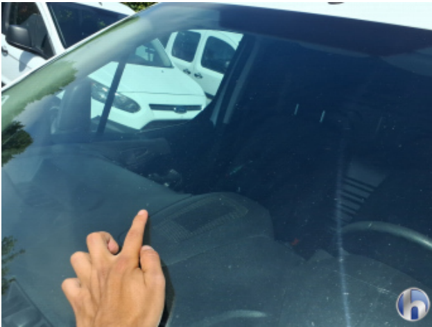
5. Windschutzscheibe Gebrauchsspuren - Ohne Reparatur