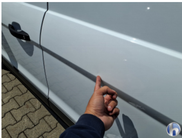
4. Tür Hinten - Links Verdellt - Sanft Instandsetzen