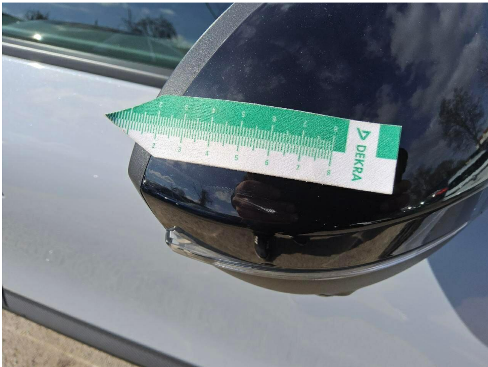
Bild 12 : Außenspiegel rechts Lackierung, verschrammt, smart repair