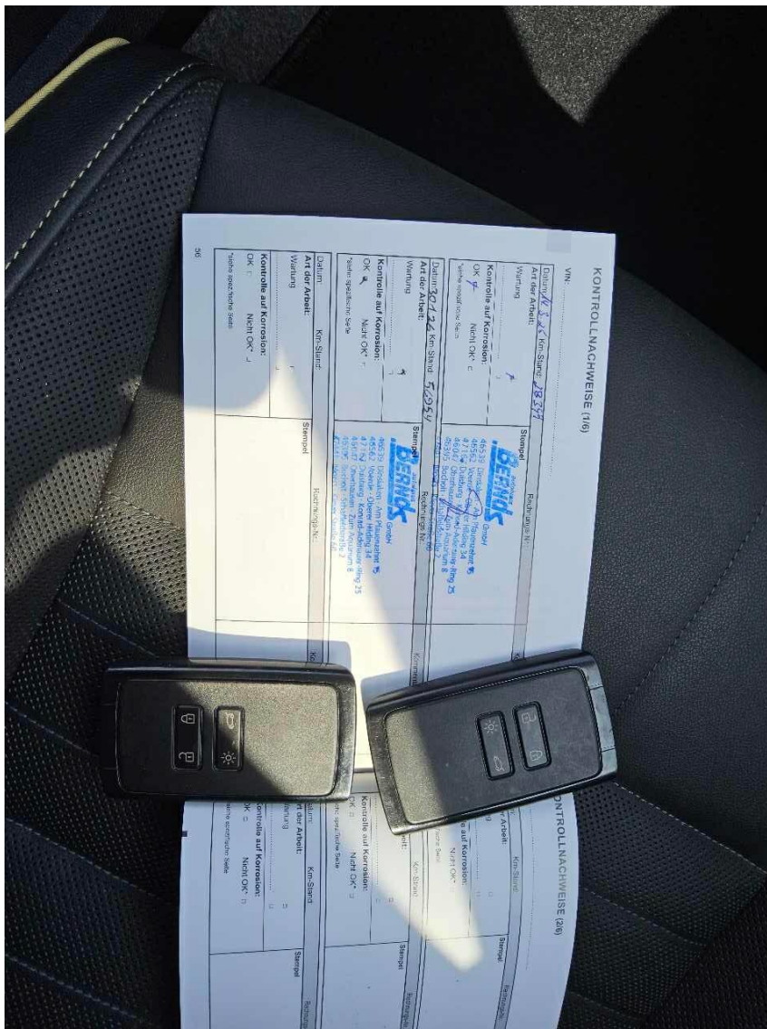
Bild 8 : Alle Fz-Schlüssel, ZLB 1, Letzter Eintrag im Serviceheft