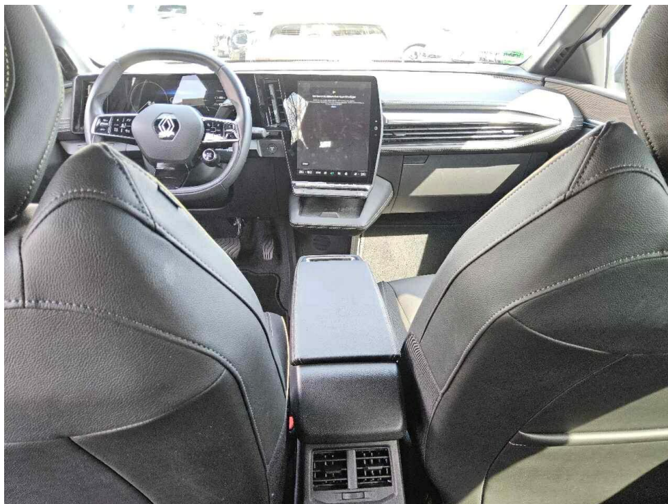
Bild 7 : Mittelkonsole des Rücksitzes (Radio/Navigation eingeschaltet)