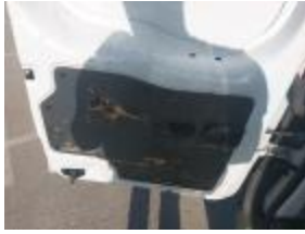
Guarnic Tapa Tras