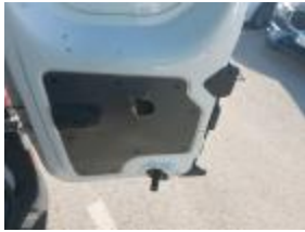
Caja Retrov Ext IZ