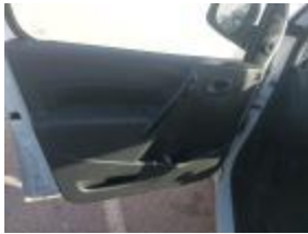
Guarnic Tapa Tras